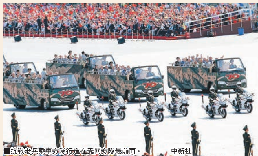
抗戰老兵乘車方隊行進在受閱方隊最前面。