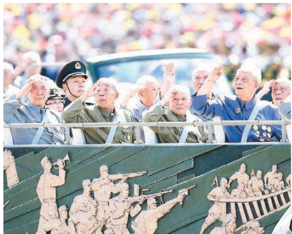
老兵乘車方隊，車身上刻畫了抗戰浮雕。