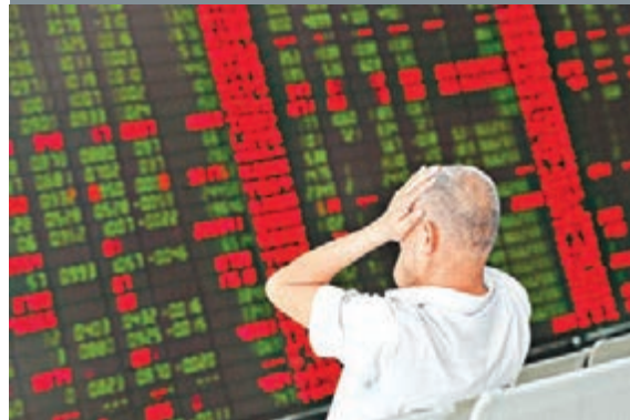
▲A股開盤不利,大幅跳空低開暴跌超4%,滬指午後一度翻紅,收市微跌0.2%。