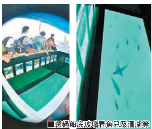
透過船底玻璃看魚兒及珊瑚等

來到沖繩怎可以不出海，於是大夥兒來到Bariyushi Beach，再坐玻璃底船出海看看海洋生物。這艘玻璃底船是特製的遊覽船，其船底裝有寬闊的透明玻璃，大家不需要下水，已可從船內觀賞海中絢麗多彩的珊瑚礁和色彩鮮豔的熱帶魚。由船中底部的透明玻璃窺視海底，在珊瑚礁中游來游去的熱帶魚就如同在桌面上一樣近在眼前，當中筆者看到最多的是六線雀鯛。