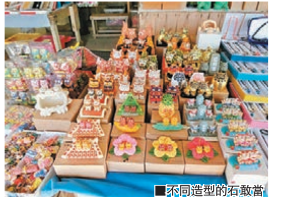
不同造型的石敢當

吃過午餐後，又來到沖繩著名的景點——萬座毛，這是位於沖繩本島西海岸恩納村的國家自然公園，「萬座毛」的由來為「可供萬人齊坐的草原」，「毛」在沖繩指的是原野。地如其名，天然的草原在眼前展開，筆者沿着小徑走，周圍群生的植物，已被指定為縣立的天然紀念物。當然，那隆起如象頭般的珊瑚斷岩絕壁是今次重要景點之一，令筆者不禁讚嘆大自然的雄偉。這裡也是香港電影《戀戰沖繩》、韓劇《沒關係，是愛情啊！》的拍攝地點之一。走畢小徑後，有一列售賣沖繩紀念品的攤子，當中有不少沖繩神獸風獅子，據知它是消災辟邪除魔的鎮物，有不同造型，可作石敢當用。