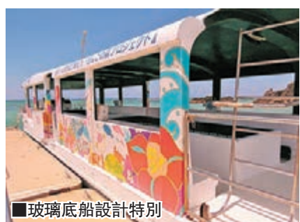
玻璃底船設計特別