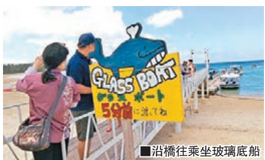
沿橋往乘坐玻璃底船