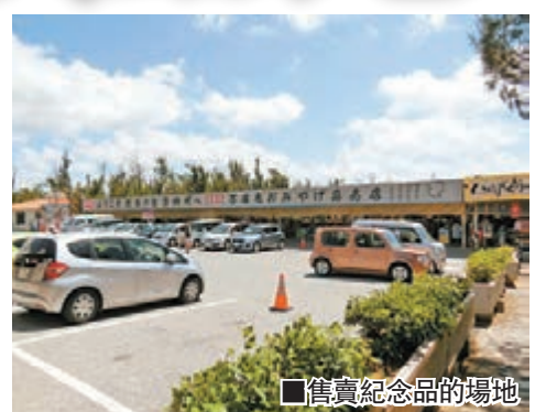
售賣紀念品的場地