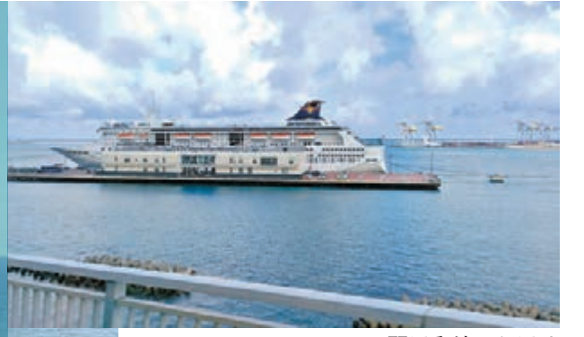
麗星郵輪天秤星號