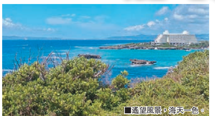
遙望風景，海天一色。