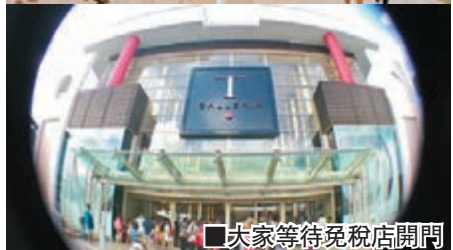
大家等待免稅店開門