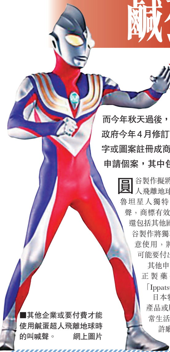
其他企業或要付費才能使用鹹蛋超人飛離地球時的叫喊聲。

日本特許廳指，音效商標註冊只適用於「能勾起對特定產品或服務回憶的聲音」，因此如熨番薯小販叫賣聲等日常生活的聲音均不作考慮。首批音效商標將於秋天通過特許廳審查後公佈。日本《讀賣新聞》