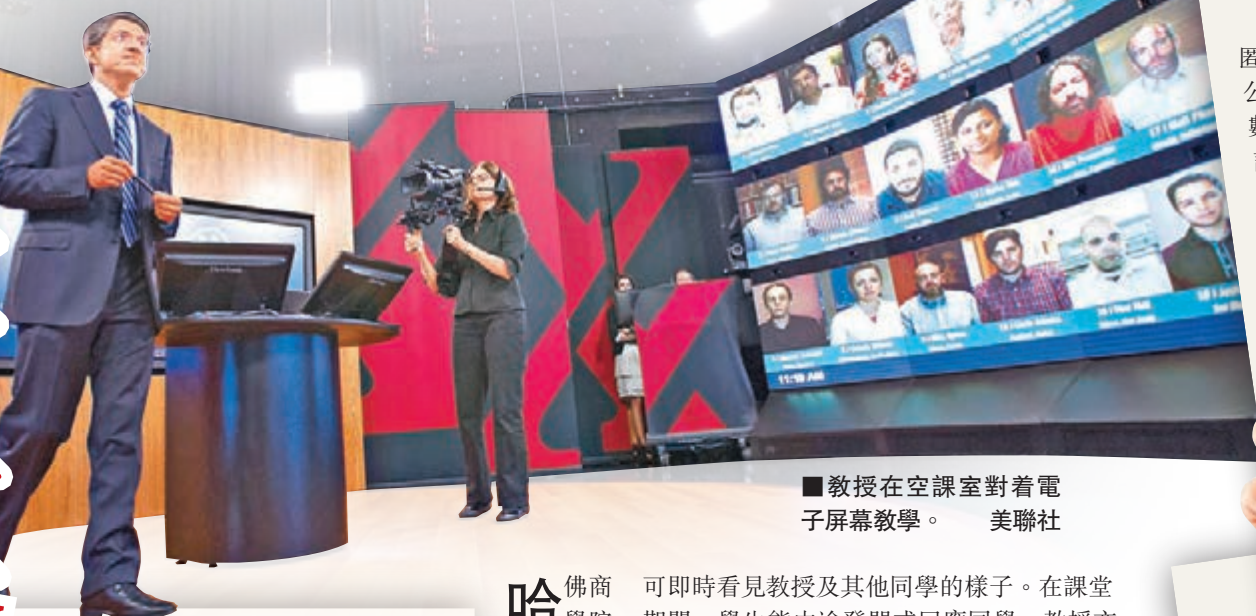
教授在空課室對着電子屏幕教學。

網上教學近年迅速發展，美國哈佛大學商學院最近更試行全新形式的課堂「HBX Live」，容許最多60人，從不同地區的電腦登入，觀看課堂直播，教授則在空無一人的課室，對着電子屏幕教學。