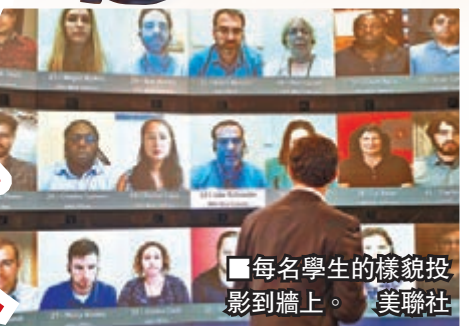
每名學生的樣貌投影到牆上。

校方派員到康涅狄格州，參觀美國全國廣播公司(NBC)攝影廠，並僱用電視製作團隊，協助現場轉播課堂。