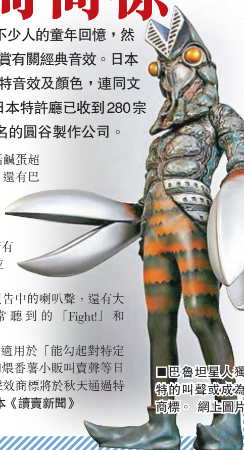
巴魯坦星人獨特的叫聲或成為商標。網上圖片