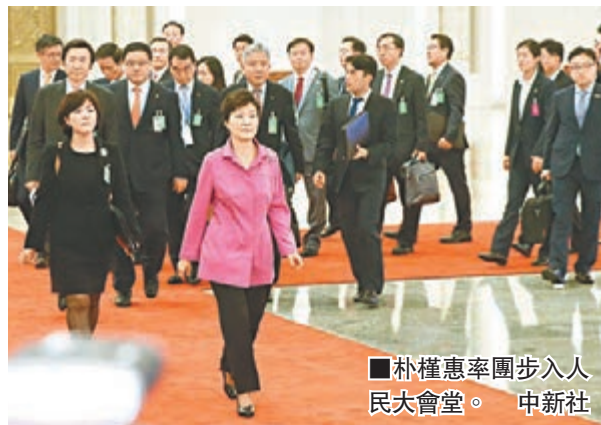
朴槿惠率團步入人民大會堂。中新社

香港文匯報訊 綜合新華社、中新社報道，中國國家主席習近平昨日在人民大會堂會見韓國總統朴槿惠。兩國元首高度評價中韓關係發展現狀。習近平強調，中韓是友好近鄰，是促進地區和世界和平的重要力量。兩國人民在反抗日本殖民侵略和贏得民族解放的鬥爭中團結互助，為世界反法西斯戰爭勝利作出了重要貢獻。