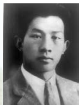
■人民音樂家聶耳。

「起來！不願做奴隸的人們……」1935年，日軍侵華不斷升級，東北淪喪、上海受侵、華北告急，國難當頭之際，雲南玉溪音樂家聶耳懷着對日寇的滿腔仇恨，及對祖國的赤子深情，用音樂作武器，創作了《義勇軍進行曲》等系列作品，「唱」響了抗戰救亡的號角。莘莘學子唱着《畢業歌》奔赴前線，萬千中華兒女誓死衛國，奮勇殺敵。在華北平原、在太行山上、在滇西小城，八路軍、遠征軍和廣大的敵後游擊隊伍一齊高歌：「我們萬眾一心，冒着敵人的炮火前進……」，直至抗戰勝利。