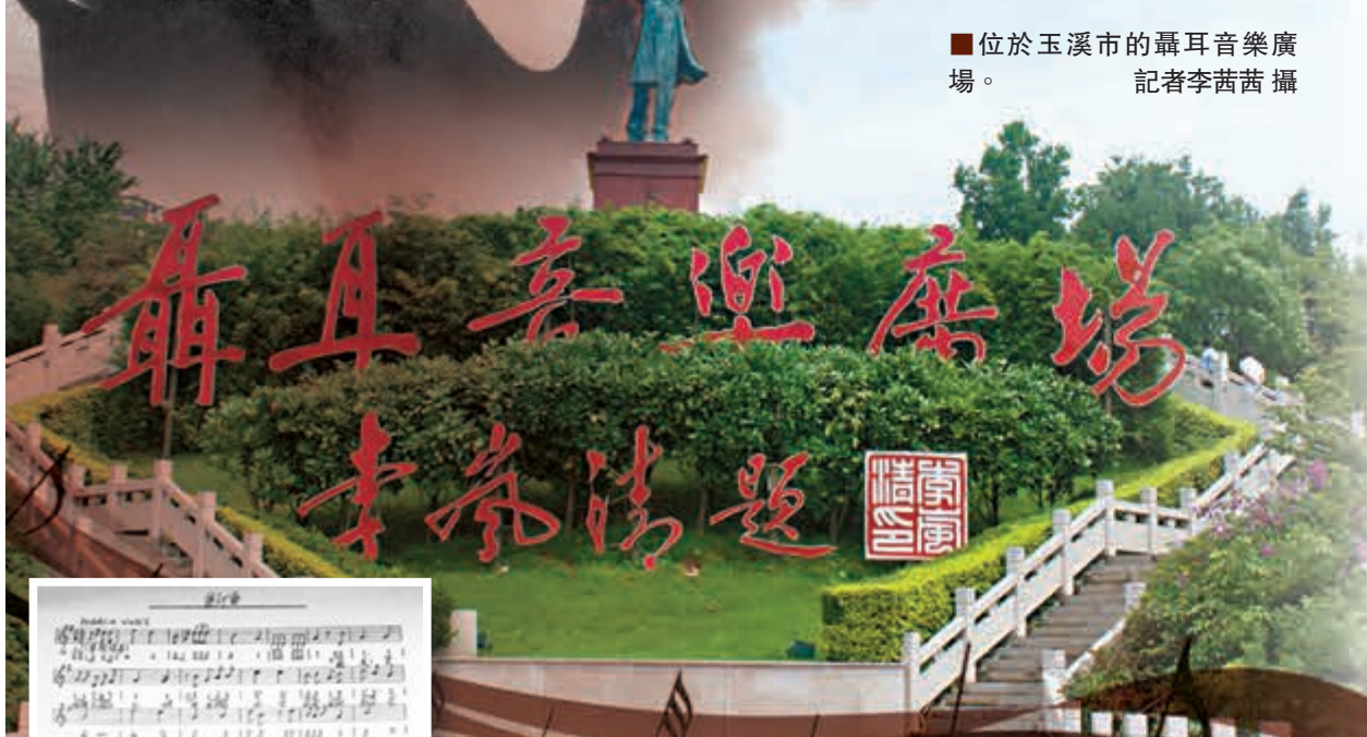
■位於玉溪市的聶耳音樂廣場。