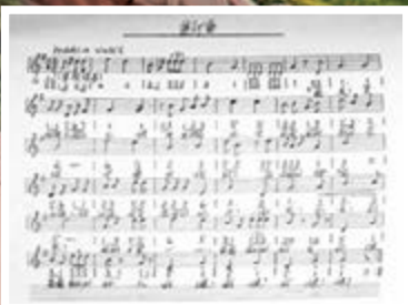
■《義勇軍進行曲》原稿。