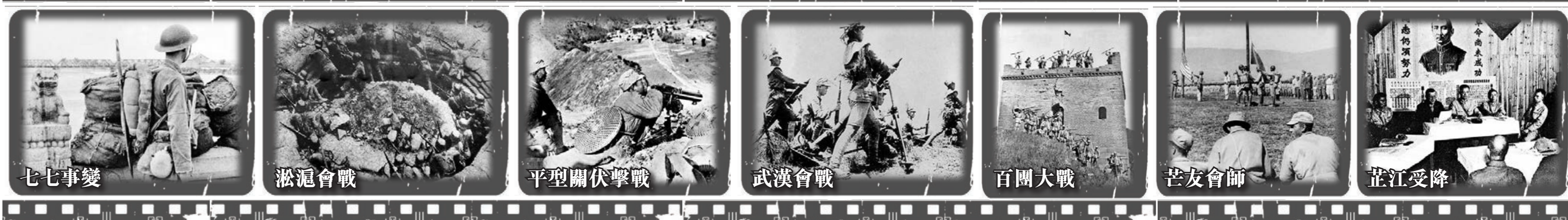
七七事變 淞滬會戰 平型關伏擊戰 武漢會戰 百團大戰 芒友會師 芷江受降

香港文匯報訊 今天是中國人民抗日戰爭暨世界反法西斯戰爭勝利70周年紀念日。70年前的9月3日，毛澤東筆力道勁的題詞「慶祝抗日勝利，中華民族解放萬歲！」刊登在重慶出版的《新華日報》醒目位置上。那天，重慶和延安，激情與歡樂相伴。此前一天，中國代表與同盟國代表一道在日本受降書上莊嚴簽字。70年後的9月3日，正義與勝利的的光芒依舊燦爛奪目，與此同時，戰勝日本法西斯的喜悅化作深深的緬懷和思考。在這重要的日子，本報刊出新華社「回望全面抗戰史詩歷程」的特別報道，同時透過珍貴的歷史圖片，與讀者一起重溫中國人民團結一致英勇抗戰的壯闊進程，緬懷先烈，激發新時代中國人團結奮鬥、珍愛和平、開創未來的豪情，共同實現中華民族偉大復興。