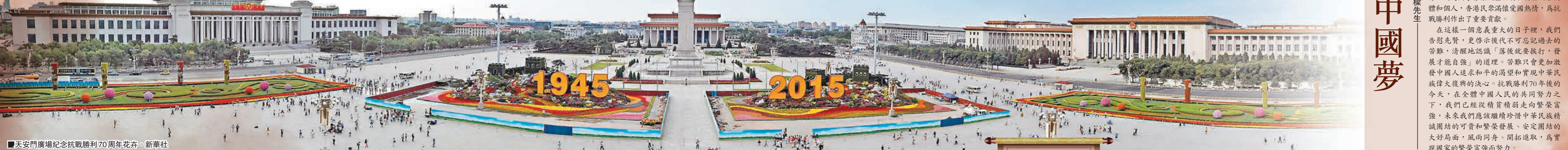
天安門廣場紀念抗戰勝利70周年花卉。

全面反攻 壓倒邪惡 抗戰相持階段，戰鬥更為激烈。老兵吳淞對被稱為「東方的斯大林格勒大血戰」的常德保衛戰記憶猶新：1943年12月3日，「從德山老碼頭到孤峰嶺，不到一公里就死了1,400多人。」 苦戰6天，中國軍隊收復常德，固守核心陣地的虎豹部隊（57師）八千餘人僅83人生還，吳淞所在的營只剩一人。