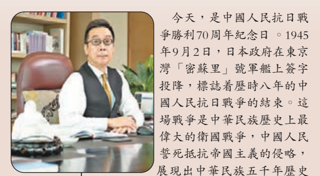
齊心創繁榮 共圓中國夢

齊心創繁榮 共圓中國夢 今天，是中國人民抗日戰爭暨世界反法西斯戰爭勝利70周年紀念日。1945年9月2日，日本政府在日本東京灣「密蘇里」號軍艦上簽字投降，標誌着歷時八年的中國人民抗日戰爭的結束。這場戰爭是中華民族歷史上最偉大的衛國戰爭，中國人民擊死抵抗帝國主義的侵略，展現出中華民族五千年歷史的強韌生命力。「駕長車，踏破賀蘭山缺，「留取丹心照汗青」，中華民族不畏強敵，不屈不撓，團結奮鬥的民族精神光輝千古。 在這個時刻，我們更加懷念那些在救亡圖存的關鍵時刻，以自己的血肉之軀拋頭顱、灑熱血，築起牢不可破鋼鐵長城的先烈們。是他們用自己寶貴的生命，換來今天中國的幸福和安寧。對一切為國家、為民族、為和平付出寶貴生命的人們，不管時代怎樣變化，我們都要永遠銘記他們的犧牲和奉獻。 自古以來，和平就是人類最持久的夙願。紀念歷史並非延續仇恨，而是以史為鑒，面向未來，在時刻警惕任何否認、美化法西斯侵略戰爭的企圖的同時，喚起全世界人民對於和平的嚮往和堅守，避免歷史悲劇重演，共同捍衛70年前反法西斯戰爭勝利果實，創造人類更加美好的未來。世界的和平需要所有人一同爭取和維護，只有和平穩定，人類才能更好實現自己的夢想。 紀念抗戰勝利對香港具有特殊意義。在三年零八個月的淪陷時期，香港市民在安全、民生及經濟等方面都飽受日軍摧殘。港人的祖先秉承不屈不撓的氣節，視抵抗侵略者為光榮使命，紛紛參加不同形式的抗日行動，保護香港，保衛國家。從東江縱隊，到國家集結大量物資和資金，各團體和個人，香港民眾滿懷愛國熱情，為抗戰勝利作出了重要貢獻。 在這樣一個意義重大的日子裡，我們告慰先賢，更啓示後代不可忘記過去的苦難，清醒地認識「落後就要挨打，發展才能自強」的道理。苦難只會更加激發中國人追求和平的渴望和實現中華民族偉大復興的決心。抗戰勝利70年來的今天，在全體中國人民的共同努力下，我們已經從積貧積弱走向繁榮富強，未來我們應該繼續珍惜中華民族精誠團結的可寶和繁榮發展、安定團結的大好局面，風雨同舟、團結進取，為實現國家的繁榮富強而努力。