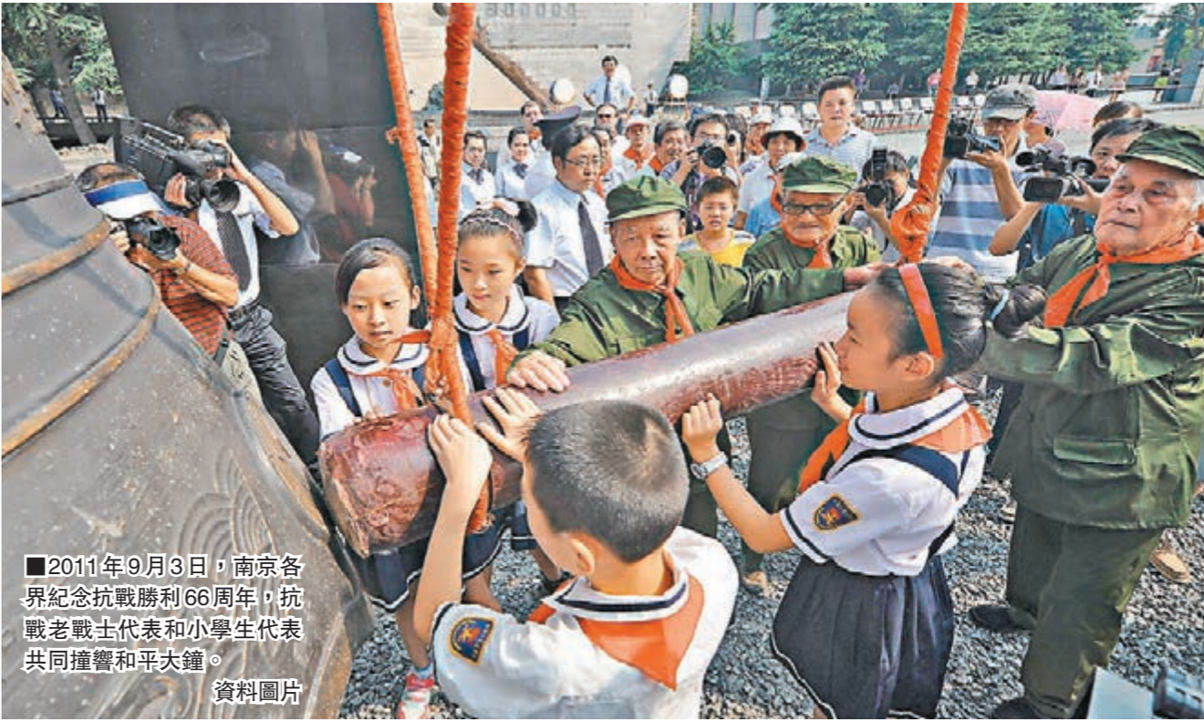
2011年9月3日，南京各界紀念抗戰勝利66周年，抗戰老戰士代表和小學生代表共同撞響和平大鐘。資料圖片

國共聯手 兄弟同仇 「國勢危殆至此，捨民族一致精誠團結，對敵抗戰外，實無他道。」1938年8月2日，郭沫若在上海文藝界救亡協會的歡迎宴會上，含淚朗誦《又當投筆請纓時》。 5天前，他離開日本回國。20天後，他出任淞滬抗戰爆發後新成立的《救亡日報》社長。這份愛國抗日報刊由國共兩黨共同出資、共同派員經營，影響力一時無兩，上海海內外仍堅持發刊，鼓舞國人鬥志。