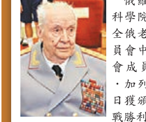
■蘇聯紅軍老戰士馬·阿·加列耶夫。

俄羅斯軍事科學院院長、全俄老戰士委員會中國分會成員馬·阿·加列耶夫昨日獲頒中國抗戰勝利70周年紀念章。「我至今仍清楚記得,當蘇聯紅軍進入中國東北城市的時候,中國的老百姓是怎樣熱烈地夾道歡迎。」這位蘇聯紅軍老戰士動情地說,他十分欣慰地看到,如今的中俄人民依然像當年那樣,共同聯手捍衛世界和平。