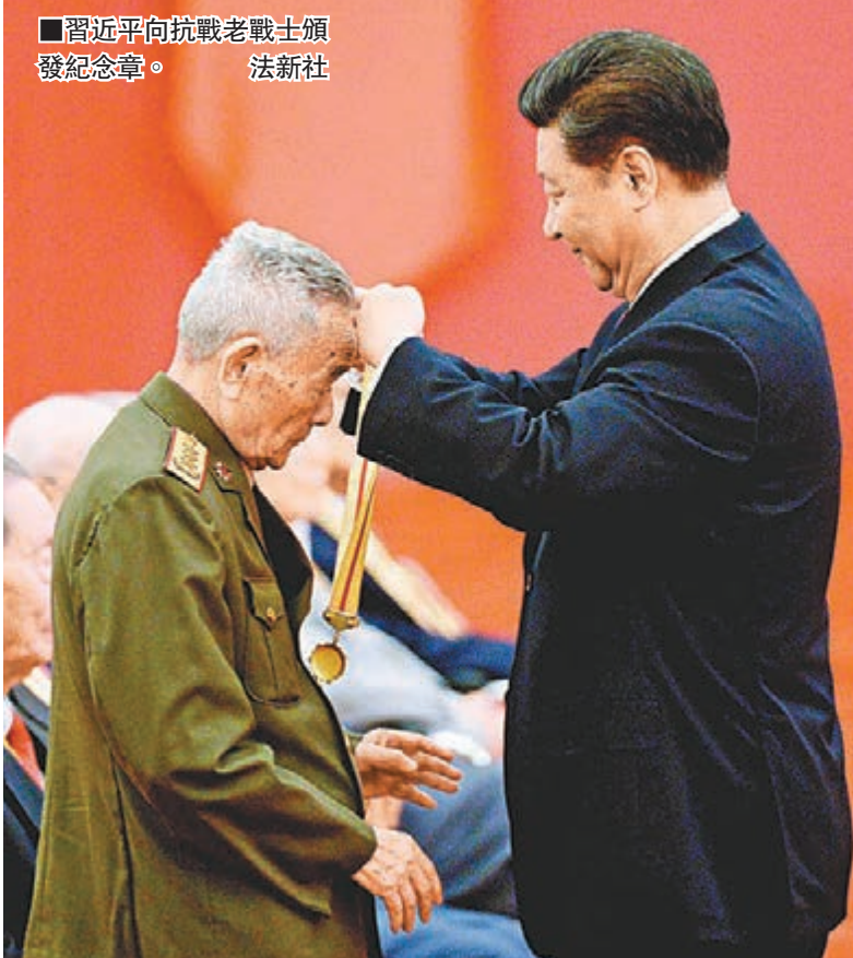
■習近平向抗戰老戰士頒發紀念章。

「天地英雄氣,千秋尚凜然。一個有希望的民族不能沒有英雄,一個有前途的國家不能沒有先鋒,包括抗戰英雄在內的一切民族英雄都是中華民族的脊梁,他們的事跡和精神,都是激勵我們前行的強大力量。」習近平最後說,實現中華民族偉大復興的目標,需要英雄,需要英雄精神,我們要銘記一切為了中華民族和中國人民作出貢獻的英雄,崇尚英雄、捍衛英雄、學習英雄、關愛英雄,共力同心,為實現「兩個一百年」奮鬥目標,實現中華民族偉大復興的中國夢而奮鬥。