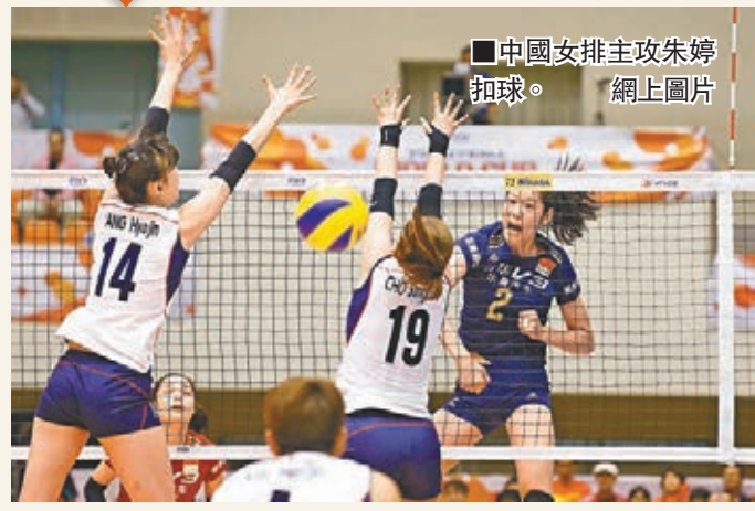
中國女排主攻朱婷扣球。

昨晚，在日本舉行的2015年女排世界盃第4輪爭奪繼續進行，面對老對手韓國隊，中國女排先輸一局，但最終連扳三局，以3:1逆轉擊敗對手，斬獲第3場勝利。中國女排贏波，主將朱婷帶傷立功；她在比賽中曾扭傷腳離場，但其發揮「中國女排精神」，及時帶傷上陣助球隊贏波。中國女排今日將對秘魯，力爭第4場勝利。(有線62、202及262台今日下午2時直播)