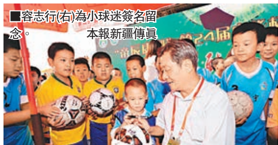
容志行(右)為小球迷簽名留念。

球員組成。100多位來自南北疆的教師也自發組團觀摩比賽。此次比賽還安排了一個特別的環節——中華盃「星發現」少兒足球賽同步進行，有200多名6歲至12歲的青少年分成14支隊伍，也將進行小組循環賽和決賽。