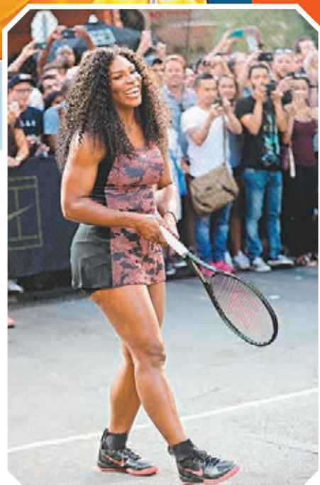
■「細威」勇態難阻，極可能贏盡今年四大滿貫。