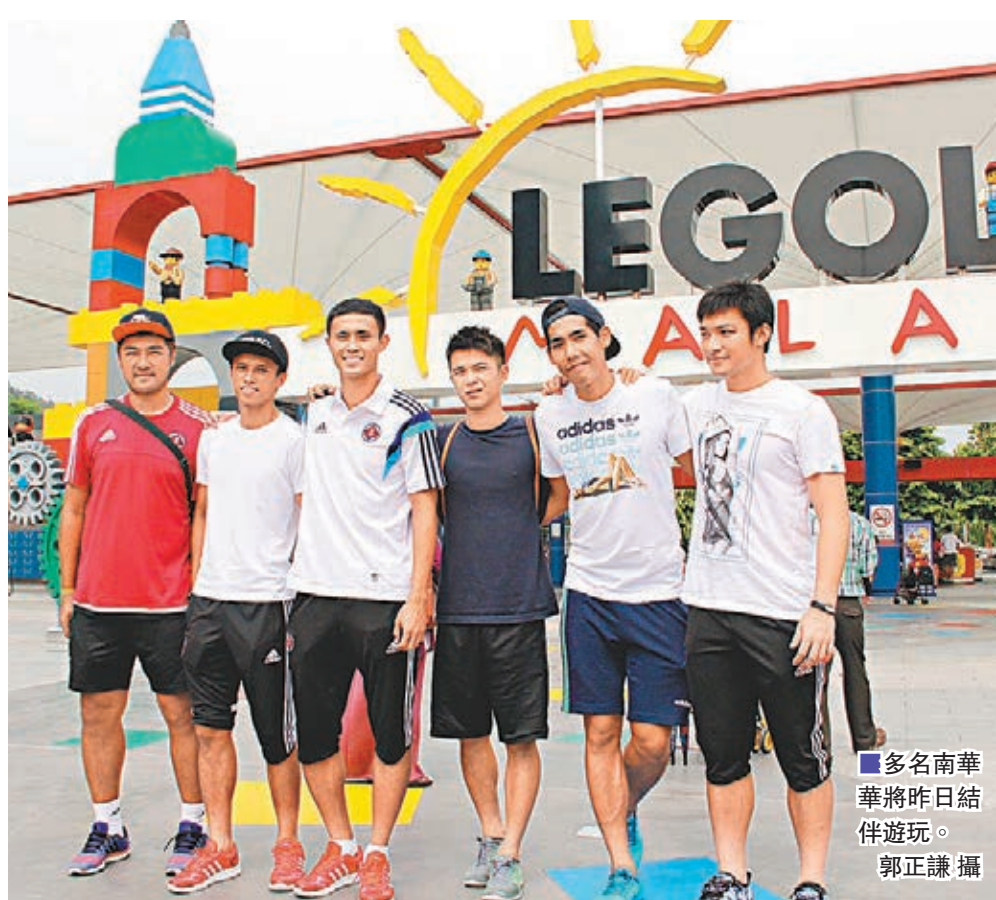
■多名南華華將昨日結伴遊玩。