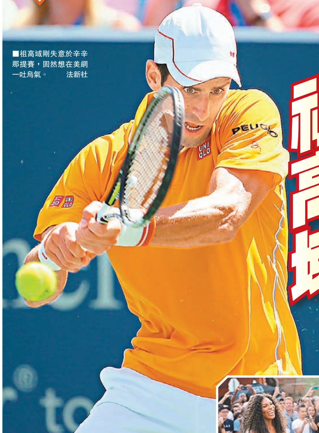
■祖高域剛失意於辛辛那提賽，固然想在美網一吐烏氣。