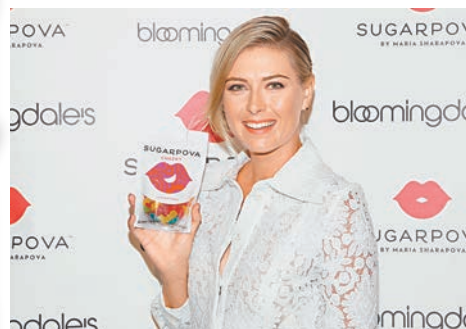
■美網3號種子「舒娃」最近力谷名下糖果。