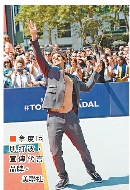
■拿度晒肌打波，宣傳代言品牌。