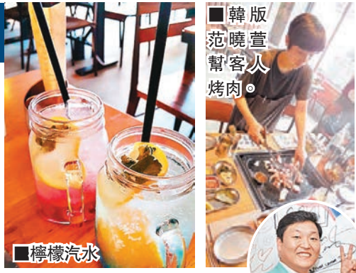
韓版范曉萱幫客人烤肉。

該店於6月開幕時，除眾YG藝天外，Rain、李勝基、李瑞鎮等紅星也有來捧場，他們在店內留下親筆簽名，成為店內一大景點。該店除提供韓國產的五花肉、豬頸肉和松阪豬肉之外，亦有泡菜湯、大醬湯、大醬伴飯等家常食品；飲料方面則有檸檬汽水、手工釀製啤酒、燒酒cocktail等特調飲品。顧客除可透過開放式廚房直接看到烹調過程外，還有侍應幫忙測溫及烤肉，專業的服務讓大家可放心享用，如果有幸，更可獲貌似台灣女歌手范曉萱的女侍應親自服務哩！