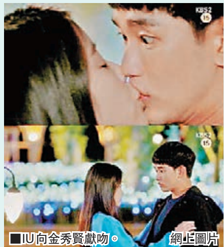
IU向金秀賢獻吻。 網上圖片