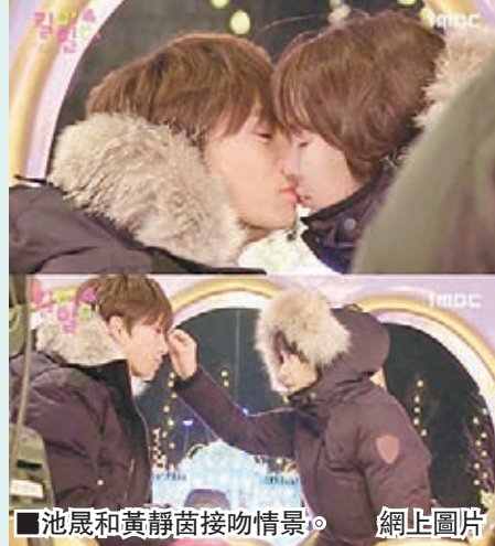
池晟和黃靜茵接吻情景。

愛寶樂園 地址：京畿道龍仁市處仁區蒲谷邑愛寶樂園路199 開放時間：10am-9pm(依季節會有不同，請以官網為準) 門票：成人₩33,000、小童₩25,000 網址：http://www.everland.com