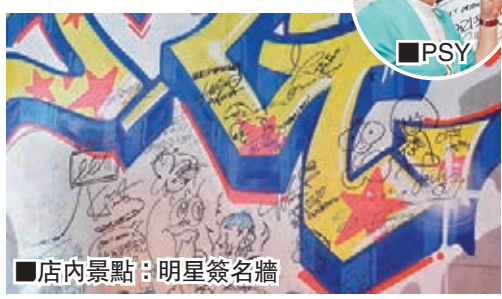
店內景點：明星簽名牆

三岔口豬肉舖 地址：首爾南浦區西橋洞361-10 營業時間：11:30am-2am