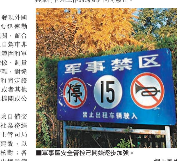
軍事區安全管控已開始逐步加強。網上圖片

工作;公安出入境邊防檢查機關依據有關法律法規,辦理人員、車輛的入境、出境邊防檢查等手續。 《通知》還提出,香港、澳門、台灣自駕車團來內地旅遊活動參照規定辦理,如簽訂有雙邊或多邊運輸協定的,按照協定辦理。 《通知》自10月1日起執行。官方多個部門1986年9月聯合發佈的《關於加強對外國人乘自備交通工具旅行管理工作的通知》同時廢止。