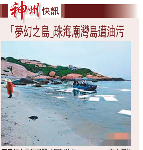
「夢幻之島」珠海廟灣島遭油污。

香港文匯報訊 據中新社報道,被港澳同胞稱為「夢幻之島」、曾因水清沙白被評為廣東最美海島之一的珠海廟灣島遭到重油污染。珠海海事局昨日表示,該局萬山港海事處接到污染舉報電話後,立即採取應急預案,組織力量前往清污。 珠海海事局現場調查人員核實:廟灣島海面油污估計有200多平方米,同時還污染了港灣內的部分岸灘、碼頭和一些運送魚貨的小艇。珠海海事局計劃用吸油氈吸附,現場負責人員表示:「如無新的油污來源,預計海面清污工作很快就可以完成。」另據珠海市海洋農業和水務局透露,暫未發現漏油事件對養殖業造成影響。 據悉,此次出現的重油屬於船舶常用燃料油,來源正在調查中。