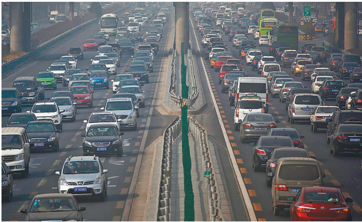
北京交通擁堵連續兩季度蟬聯內地堵城冠軍。資料圖片

廣州晚高峰車速慢如跑步 另外,此次報告還將遼寧大連評為上班最艱難城市,早高峰擁堵持續時間最長;晚高峰時期,在廣州平均駕車1小時約移動不到7公里,僅相當於人跑步的速度;深圳成為夜生活最豐富之城,而無錫則是最暢通的愜意之城,全天24小時不堵車,是內地上下班時間成本最低的城市。 與去年同期相比,今年二季度,45個監測城市中有40個城市道路交通在逐漸惡化。其中北京、廣州、深圳、上海、杭州、太原、成都等一線及二線主要城市擁堵加重明顯。影響因素