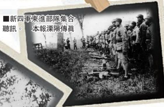
■新四軍東進部隊集合聽訊。