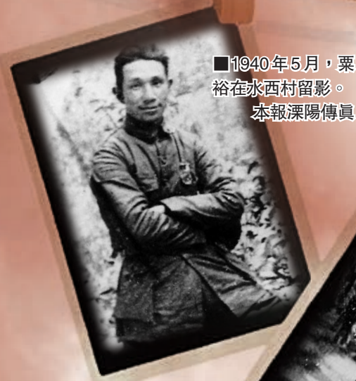
■1940年5月，粟裕在水西村留影。