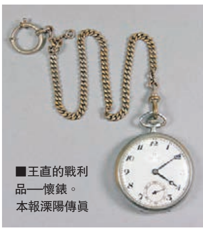
■王直戰利品—懷錶。本報溧陽傳真

在紀念館諸多文物中，有一批文物是新四軍當年在戰場上打敗日軍繳獲的戰利品，包括日軍的刺刀、飯盒、毛毯等。其中，有一塊由開國少將王直捐贈的貼身物品—懷錶，它陪伴將軍歷經了抗日戰爭、解放戰爭、抗美援朝，直至和平年代。英姿勃發的少年如今已是白髮蒼蒼的老人，只有懷錶還是當初的模樣。