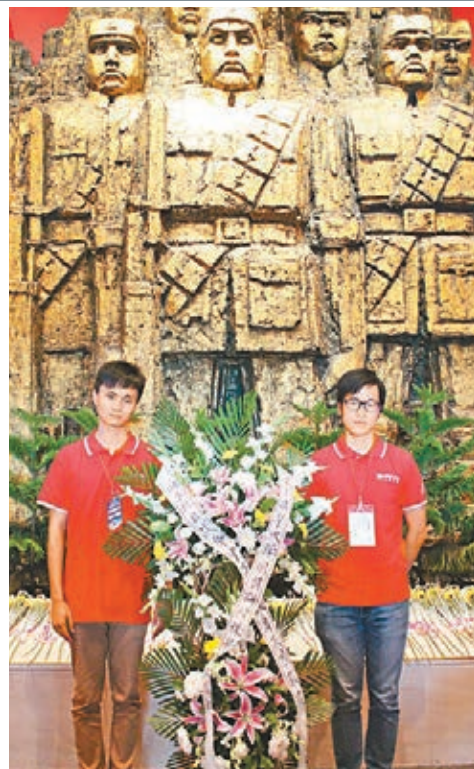
香港學生代表向烈士雕像獻花,以紀念為抗戰犧牲的英烈。

在抗日戰爭紀念館,同學參觀了《「偉大勝利 歷史貢獻」——紀念中國人民抗日戰爭暨世界反法西斯戰爭勝利70周年主題展覽》,展覽分為「中國局部抗戰」、「全民族抗戰」、「中流砥柱」、「日軍暴行」、「東方主戰場」、「得道多助」、「偉大勝利」及「銘記歷史」等8個部分,令港生對中華民族