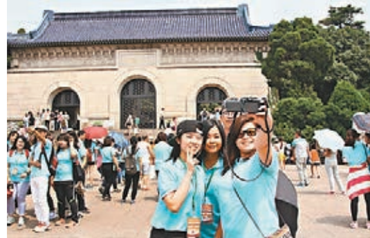
港生在中山陵參觀自拍。