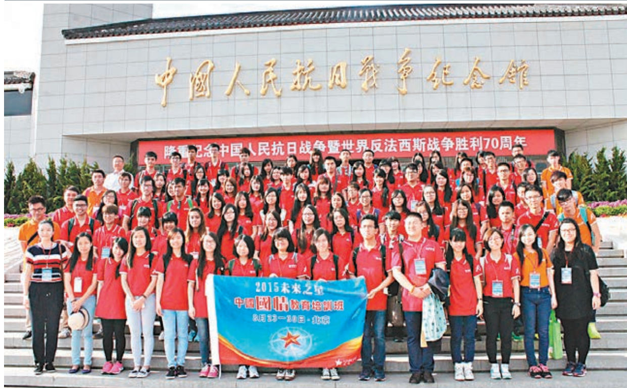
未來之星學員參觀中國人民抗日戰爭紀念館。

香港文匯報訊 (記者 江鑫嫻、實習記者 任芳韻 北京報道) 在北京參觀學習的未來之星學員,本月25日專程來到位於北京豐台區宛平城的中國人民抗日戰爭紀念館緬懷歷史,向英烈致敬,祈願世界和平。參觀過程中,同學均表示,以前只能在書本上看到抗日戰爭內容,今次看到很多實物和圖文,非常震撼,指中國人要記住這段歷史,勿忘國恥。有同學慨嘆:「緬懷歷史,珍愛和平,對於人類而言,和平才是最重要的。」