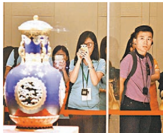
同學參觀南京博物院。