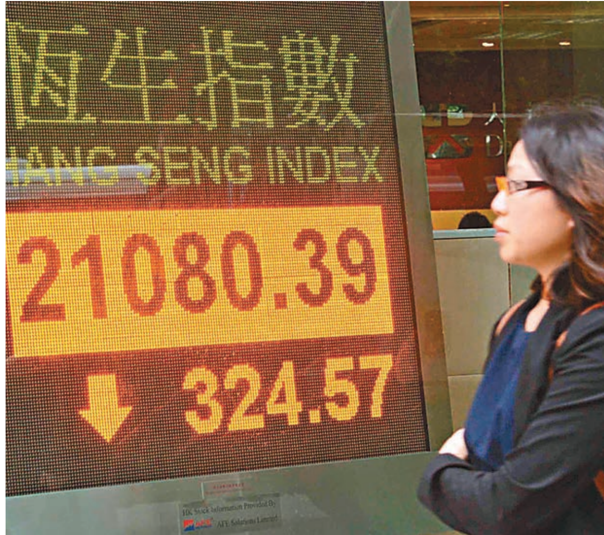
■恒生指數追隨A股走勢而下跌1.5%,跌幅大於上證綜指。中新社

香港文匯報訊(記者 周紹基)人行「減息+降準」的救市組合拳,讓前晚外圍股市只興奮了半夜,鐘聲一響公主變回灰姑娘,港股A股又重回昨日的殘酷世界。兩地股市昨日好淡爭持激烈,走勢比過山車更波動,恒指收跌324點,跌回二萬一邊緣,指數創兩年新低,更出現「死亡交叉」,即恒指50天平均線跌穿250天平均線,確認港股進入熊市。翻查過去幾次熊市,發現「死亡交叉」出現後,恒指還要再跌11%至77%,熊市才會完結。晚上美股中段升逾130點,惟港股ADR指再跌97點,報20,983點。