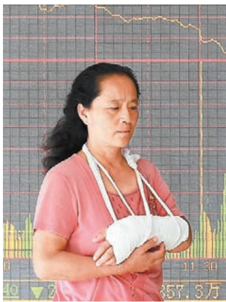
■A指昨日大幅震盪後低收,股民手傷,錢包也傷。

香港文匯報訊(記者 章蘿蘭 上海報道)雖有央行「雙降」利好扶持,期指亦被重點監管,但A股投資者昨日出現巨大分歧,掀起3,000點爭奪戰,盤中9度上落走勢誇張過山車,震幅高達8%。上證綜指最終收跌1.27%,報2,927點。深成指與創業板指也是猛烈波動,振幅分別錄得7%、8%。截止收市,深成指已跌破10,000點整數關口,報9,899點,創業板指更是大跌5.06%。