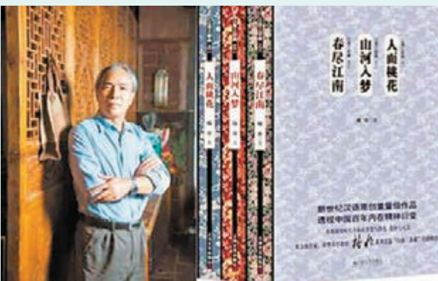
■格非作品《江南三部曲》呈現了一個世紀以來中國社會內在精神的行變軌跡。

81歲的作家王蒙則憑藉舊作獲獎，《這邊風景》是其上世紀六七十年代下放新疆農村勞動期間創作的長篇小說，因各種緣由未曾付梓，但在《王蒙自傳》和各版本評傳中都有所提及，早有聲名卻遲遲未露面。小說反映了漢、維兩族民眾在特殊的歷史背景下的真實生活，以及兩族人民的相互理解與友愛共處。