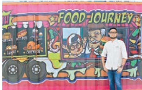
■Depp以自己與爺爺的美食旅程為主題，創作《愛在食物的旅途上》。