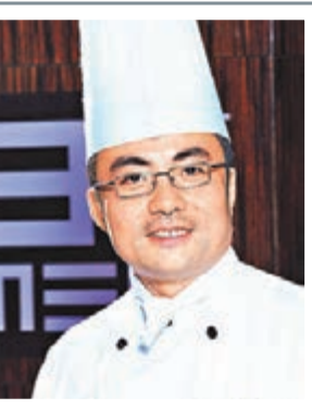
張志鋒時最愛在上海弄堂品嚐坊間「媽媽菜」。