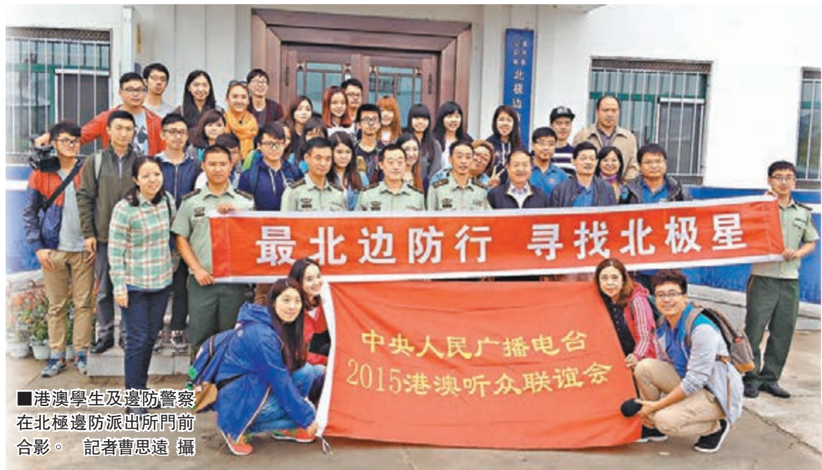
港澳學生及邊防警察在北極邊防派出所門前合影。

香港文匯報訊(記者曹思遠黑龍江報導)由中央人民廣播電台對港澳節目中心舉辦的第十一屆港澳聽眾聯誼會暨港澳媒體採訪活動,已於上周連續五天在黑龍江哈爾濱及漠河縣展開。此次活動圍繞「今天我要當記者」主題,邀請20餘位港澳大學生參訪哈爾濱經濟開發區,東北虎林園,漠河的「北極」邊防派出所、哨所,大興安嶺「五·六」火災紀念館等地,體驗記者採訪及新媒體發佈消息的工作和生活,從而感受當中的苦與樂。