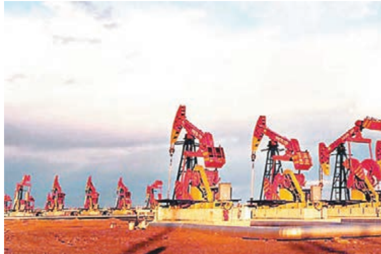
中國石油在新疆累計產油4.9億噸。

香港文匯報訊（記者 秦占國、羅洪嘯 烏魯木齊報道）本報記者獲悉，十三五期間，中國石油天然氣集團（下稱「中石油」）公司將繼續加強新疆「四個基地、一個通道和兩個總部」建設，力爭到2020年油氣產量