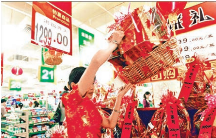
內地超市驚現高價月餅。

在福建福州中庚喜來登酒店，包裝精美的多款禮盒正接受預訂。銷售人員介紹，一款名為「臻月禮盒」的產品目前最受歡迎，這款內裡裝有6個月餅，外盒上印有一幅精美的花鳥畫。「這幅花鳥畫是中國美術家協會會員董希源的作品。」銷售人員特別介紹，「月餅吃完後，外盒可以拆下，單獨作為花鳥畫裱起。」酒店推出的另一款「尊月禮盒」，外表與「臻月禮盒」大同小異，同樣配有董希源的花鳥畫，層數則由單層變為雙層，這款有8枚月餅的禮盒，售價488元。除了月餅禮盒，酒店還推出了售價1,388元的配有進口紅葡萄酒等產品的「花好月圓禮盒」。在福州香格里拉