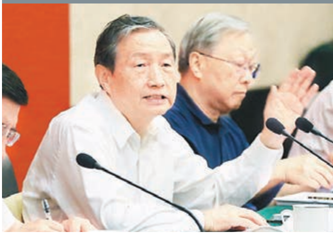
■馬凱出席會議並講話。

香港文匯報訊 據新華社報道，國家製造強國建設戰略諮詢委員會成立大會昨日在北京召開。中共中央政治局委員、國務院副總理、國家製造強國建設領導小組組長馬凱出席會議並講話。