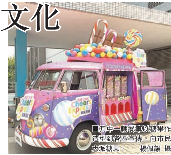
■其中一輛餐車以糖果作造型到各區宣傳，向市民派派糖果。

參與活動的日式粵菜始祖尹達剛表示，在30年前到日本時，已看到有人在貨櫃內開麵店，認為香港也可以引入此概念。他稱，在改裝貨櫃或美食車提供食品時，需要留意的是品質及衛生，「溫度好重要」，盡量避免使用奶類及肉類食品。