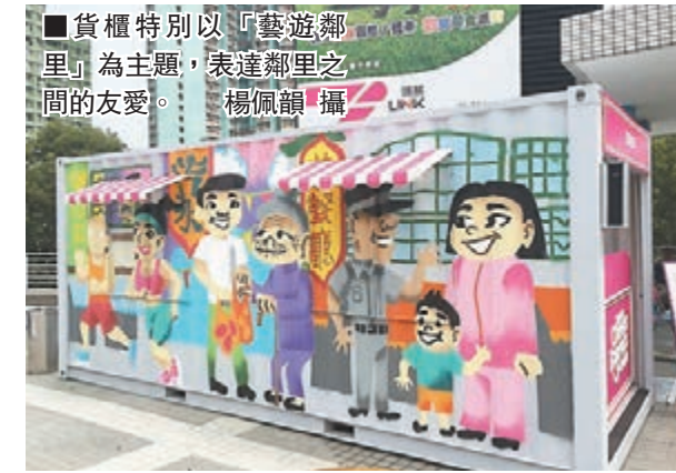
■貨櫃特別以「藝遊鄰里」為主題，表達鄰里之間的友愛。

香港文匯報訊（記者 楊佩韻）財政司司長曾俊華在財政預算案中，建議引入歐美流行的美食車（Food truck），穿州過省為各地居民帶來美食快捷。有商場率先引入「美食餐車文化」概念，在露天平台設置改裝貨櫃及餐車，擬為美食車作示範。有參與活動的廚師表示，政府的美食車概念很好，但需要考慮租金、食物補給及停泊位置等多方面因素，冀政府能聽取他們的意見，盡快成事。