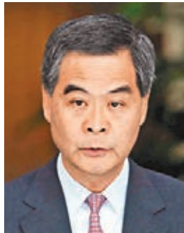
■特首梁振英

香港文匯報訊(記者 周紹基)全球股市波動,A股與港股連日急挫,令投資者憂慮類似97金融風暴的危機重現,港府官員再向市場派定心丸。特首梁振英昨日回應稱,與十八年前亞洲的情況相比,今日亞洲各個主要經濟體的實力變好,而且各地政府即使是發展中國家的政府,她們都已汲取過97年危機的教訓,規管和監管能力都比十八年前好得多,故不應將現況與當年相提並論。