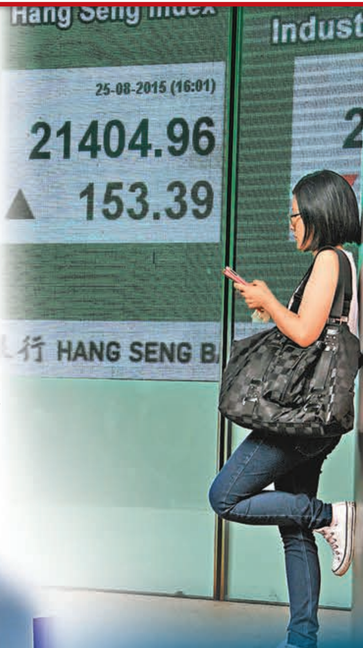
■恒生指數昨日出現低開後急彈,倒跌後又漲153點收市的局面。