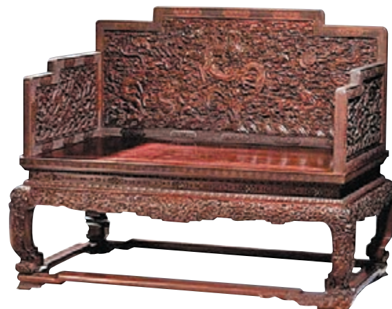
乾隆御製紫檀八寶雲蝠紋「水波雲龍」寶座。

呈現同受西風東漸影響的乾隆珐瑯彩「西洋仕女出遊」圖筆筒、乾隆銅鎏金蓬萊八仙音樂座鐘等。音樂座鐘高74cm，分為上下兩個主體部分，是一座典型的廣鐘。鐘身上部為木雕而成的蓬萊仙山，雕刻工匠將自己精湛的雕工與大自然的鬼斧神工巧妙融合在了一起。