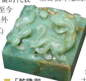
「乾隆御覽之寶」寶璽。

在其精心的佈局及雕琢下，整座仙山線條流暢而不突兀、雄奇又不失雅致，仙台樓閣、靈石異草、石階小道分佈其中，一派古幽神奇之感渾然天成。為配合展覽，龍美術館還舉行多場研討會和整理出版相關文集。展覽現正對公眾開放，展期3個月。