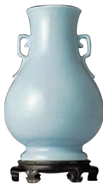
乾隆仿汝窯雙如意耳瓶

師金農的《無量壽佛》，估價約94萬至156萬(港幣，下同)。金農獨特的畫風在此作之中體現無遺，別具一格的長構圖中可見無量壽佛神情安然飄逸，衣紋用筆粗獷古拙，勁道的筆力將高古之風表現得淋漓盡致。另一珍品為清乾隆御製紫檀鏤空西番蓮雲蝠紋邊架几案，估價約500萬至750萬，此几案由暗面和兩几、兩塊穿花擋板立部分組成，周圍透雕及雕相應的雲蝠紋和西番蓮紋，為清宮造辦處的典型代表作。