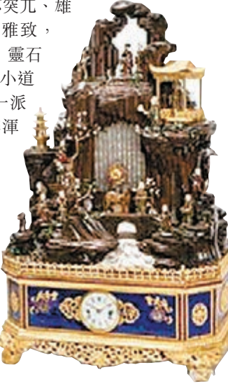
乾隆銅鎏金蓬萊八仙音樂座鐘