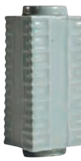
蘇富比宋龍泉窯青釉琺瑯式瓶

佳士得將在下月的紐約亞洲藝術周內舉辦10場亞洲藝術品的拍賣，此季拍賣將帶來重要的中國瓷器及工藝精品拍賣等一系列珍品，推出斯普勒珍藏、黎氏家族珍藏、索維爾珍藏、露芙及卡爾·巴倫珍藏，以及美國私人座子珍藏等。拍品涵蓋中國書畫、喜瑪拉雅繪畫及雕塑、宋瓷、當代藝術、中國古典傢俱、鼻煙