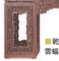
乾隆御製紫檀鏤空西番蓮雲蝠紋邊架几案

古玩珍藏品首推清雍正黃地青花纏枝蓮托八寶紋大盤《大清雍正年製》款，估價約188萬至220萬，此盤器形恢弘，品相完美無瑕，黃彩均厚潤實，青花發色濃重深沉。「一期一會·聽茶聞香」專場當中最受矚目的為奇楠山子，估價約500萬至626萬。秦藏六造純金獸口饕餮紋壺，估價約75萬至94萬，造型古樸典雅，剛柔並濟，其重1,278克，是同類作品中最重的一件。