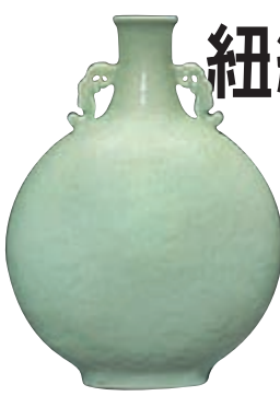
佳士得將拍 Marilyn Jones 舊藏乾隆粉青釉刻纏枝蓮紋大抱月瓶

壺、外銷瓷、座子、掐絲珐琅器、古代青銅器等類別。9月16日將在紐約洛克菲勒中心舉行的露夫及卡爾·巴倫珍藏中國鼻煙壺專場，重點拍品包括一件御制粉紅地套五色玻璃花籃紋鼻煙壺、一件馬紹先作玻璃內畫花鳥圖詩文鼻煙壺、一件涅白地套藍白玻璃「踏雪尋梅」圖鼻煙壺等，均為不可多得的精品。9月17日和18日，壓軸的兩場「中國瓷器及工藝精品」(上、下)拍賣則更是帶來一系列珍品。