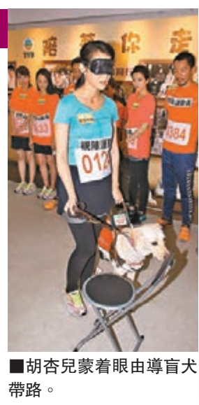
■胡杏兒蒙着眼由導盲犬帶路。