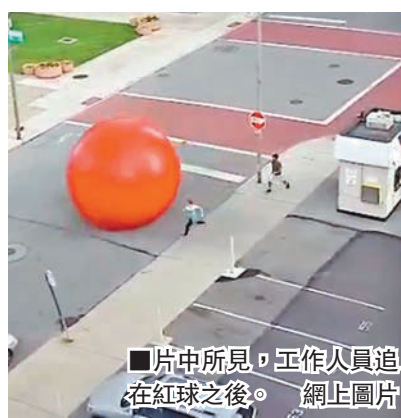
■片中所示，工作人員追在紅球之後。網上圖片

美國俄亥俄州驚現巨型紅球襲路面！原來這是紐約藝術家佩爾斯著名作品「紅球計劃」(Red Ball Project)的藝術裝置，他由2009年開始應邀帶着紅球巡迴展覽，最近回國展出，在俄亥俄州托萊多美術館外佈置期間，突如其來的強風及驟雨將重約113公斤、直徑約4.5米的紅球吹走，工作人員唯有追着截停它，場面滑稽。 ■《每日郵報》/澳洲新聞網