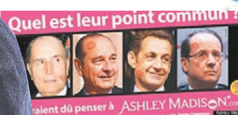
■Ashley Madison曾有婚外情的法國總統宣傳。網上圖片