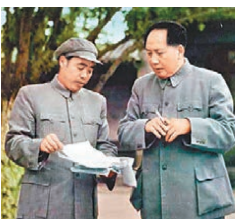
毛澤東與汪東興 (攝於1955年)。

汪東興從1947年開始一直擔任毛澤東警衛工作，先後近30年。政協廣東省委員會主任、主辦的《同舟共濟》曾刊發文學學者陳立旭一篇記敘汪東興幕後工作的文章。其中提到，毛澤東曾這樣評價汪東興：