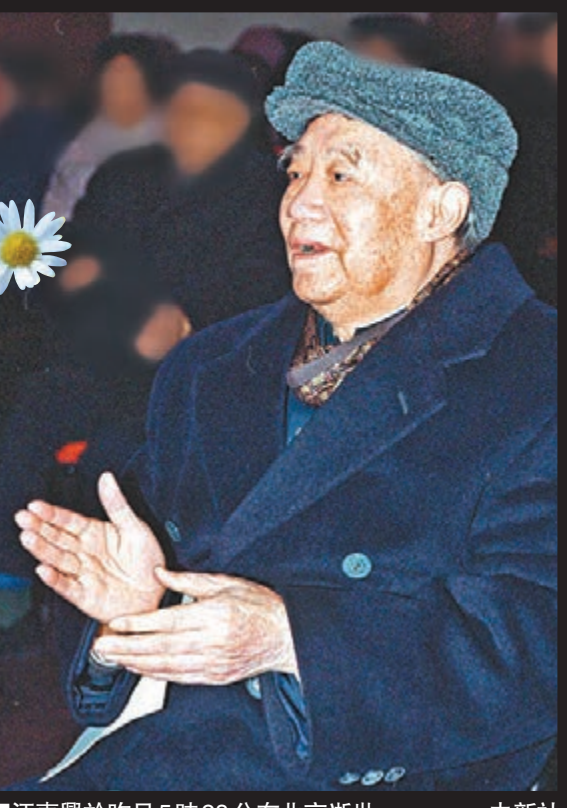
汪東興於昨日5時28分在北京逝世。

1976年10月6日晚11時，中央政治局在玉泉山開會通報粉碎「四人幫」的情況。汪東興最後說了一句話：如果「四人幫」改變成功，在座的都得上斷頭台。這句話得到了與會同志的一致贊同。