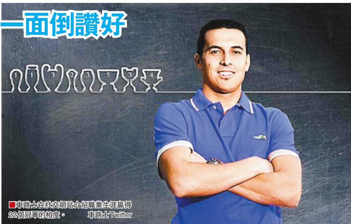
車路士在社交網站介紹職業生涯贏得22個冠軍的柏度。車路士Twitter