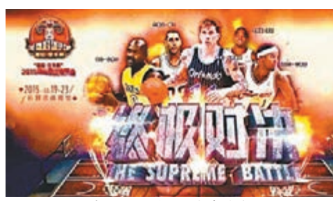
■福建石獅舉辦的村級籃球賽海報。