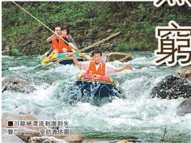
川龍峽漂流刺激到失聲。