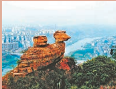
九龍十八灘景區內的奇景「金雞嶺」。