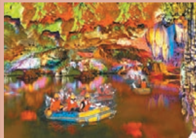
神筆洞地心漂流，景觀千奇百怪，洞中有洞。