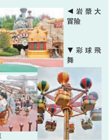
彩球飛舞 魔法單車