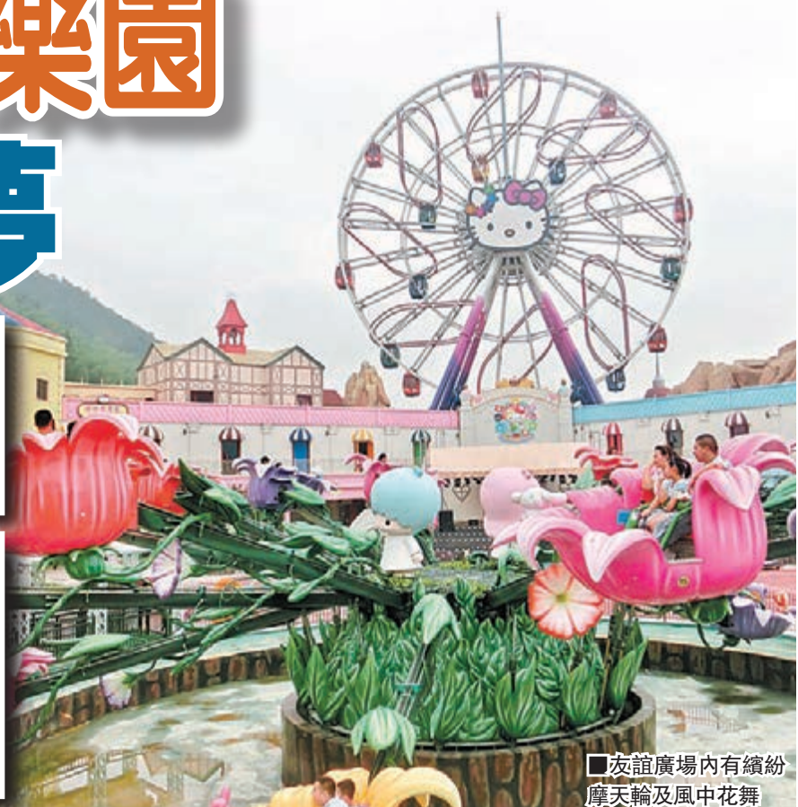
友誼廣場內有繽紛摩天輪及風中花舞