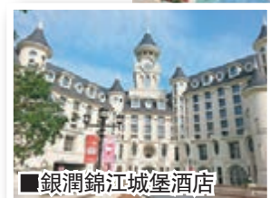
銀潤錦江城堡酒店

友誼廣場適合所有的孩子，孩子們進入凱蒂貓家園，第一眼就能看到的繽紛摩天輪是目前世界第三台、亞洲第一台的滑道式摩天輪。屹立在離地9米的商店樓層上，擁有8個固定座艙，8個沿菱形軌道「轉」活動座艙，間隔式組合，喜歡刺激的坐菱形軌道「轉」，當車卡跌進某個角度時，進入自己的小軌道滑下，即會加速兼搖擺不定，盪來盪去的，同行的朋友玩過都大讚這個搖擺車卡過癮。菱形軌道這類設計在日本也沒有。細膽的坐外圍「公轉」的，遊客在艙內享受悠閒美妙時光，在42米的高空一覽整個凱蒂貓家園歡樂的景象。這區還有風中花舞，孩子們將與Hello Kitty一起乘着花朵在空中旋轉。