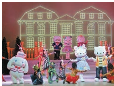
▲▲在凱蒂貓小院的內的天使劇場，欣賞《美好的心願》。