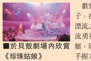
貝殼劇場內欣賞《珍珠姑娘》