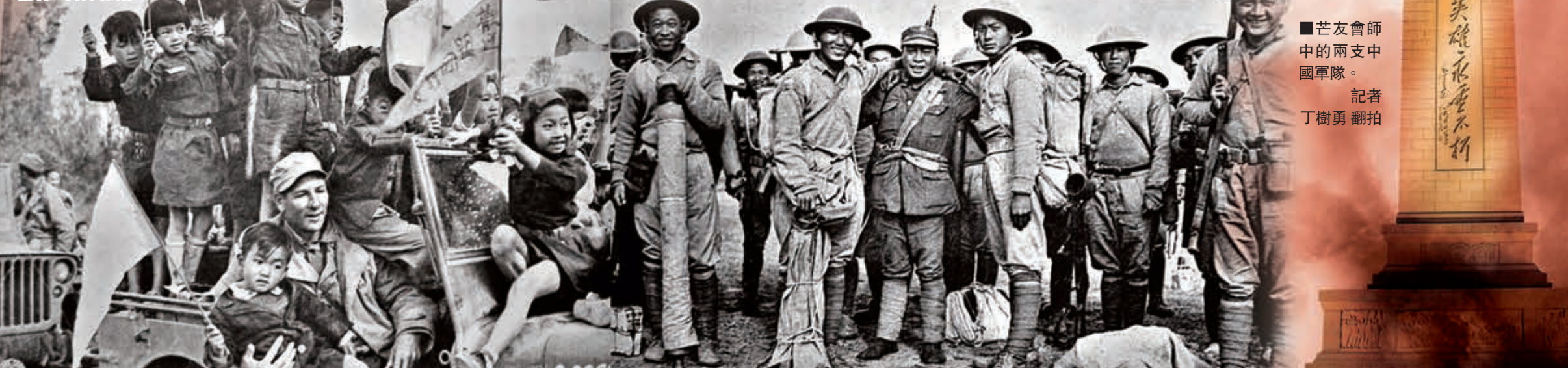
■芒友會師中的兩支中國軍隊。