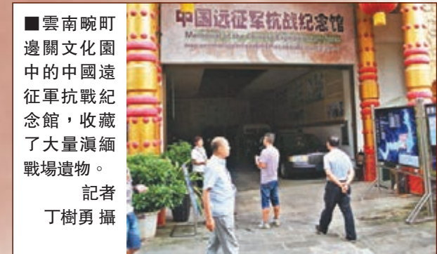
■雲南畹町邊關文化園中的中國遠征軍抗戰紀念館，收藏了大量滇緬戰場遺物。