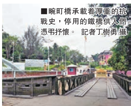
■畹町橋承載着厚重的抗戰史，停用的鐵橋供人們憑吊抒懷。 聲地提示兒子。 距畹町橋不遠處，北汽瑞麗生產基地建設工地熱火朝天，將成為面向緬甸等東南亞國家和內地西南地區的汽車產業基地。

這座長僅20米、寬5米、高9米的鐵橋，如今被保護下來專供人叩訪抒懷。舊橋東側三四米處，是今日中緬兩國邊民互訪、商貿往來的新橋，中緬兩國的國旗在畹町新橋兩端迎風飄揚，提示着人們這裡是中緬兩國國界；而置於橋頭修建滇緬公路遺留下的石碾子，又清晰地提示着人們：這裡有一段壯懷激烈的抗戰史。「想像一下，10萬遠征軍跨過這座小橋出國抗日，是何場景？」張女士輕