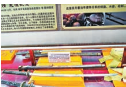
■日寇軍刀為遠征軍後人捐贈。 門戰鬥或許只是一場小型戰鬥，很少為人提及。然而，這又是一場真正將日寇趕出國門的具體戰鬥，「是一場值得讓後人紀念、讓國人自豪的戰鬥！」王繁華說。