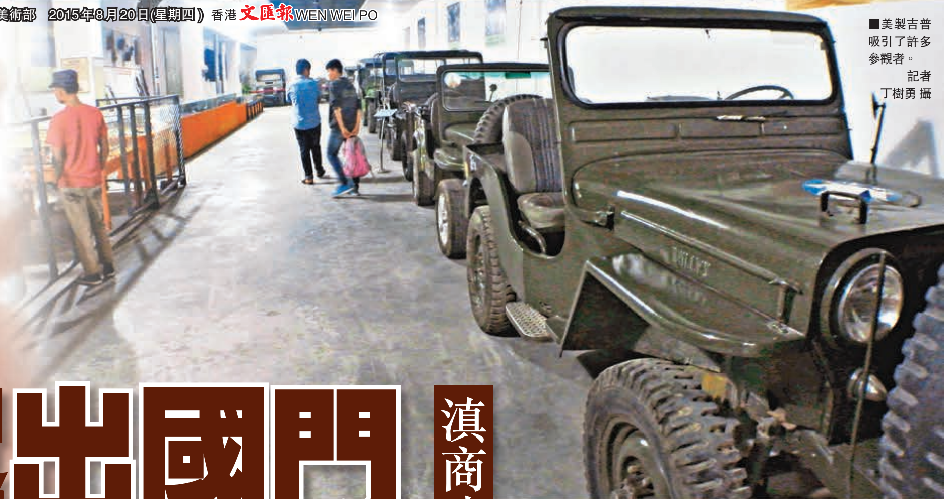
■美製吉普吸引了許多參觀者。