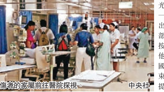
傷者的家屬前往醫院探視。

定義或有別 購買要留神 羅少雄又指,旅遊保險不像大廈第三者保險及汽車保險,對意外有同一的定義,形容是「可加可減」,以今次泰國曼谷爆炸襲擊案為例,每間公司的賠償準則不一,建議港人下次購買保險時要多留神。 被問到在紅色外遊警示下,港人決定如期出發到曼谷,保險公司會否不受理?羅少雄稱,要看該份旅遊保險的承保範圍,不能一概而論,如要較為全面的保險,可選擇1年內有效的意外保或平安保,再加醫療保險,但費用就較為昂貴,1年約1,000元。 香港保險師公會會長麥永光稱,如果旅客出發外遊前一星期,政府當局對當地發出任何級別的旅游警示,大部分的旅遊保險都有條款,按情況賠償已繳交的旅費。他說,如果旅客已身處泰國,因應旅遊警示而提早結束行程,也可以向保險公司提出索償。