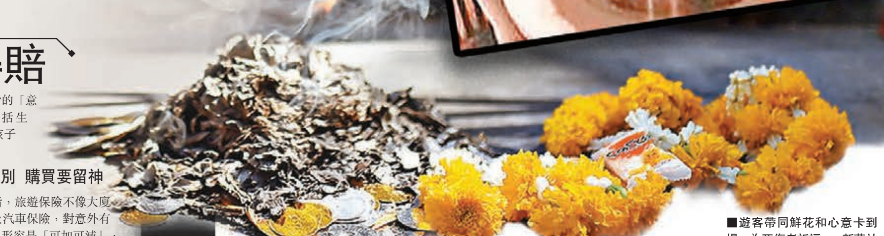
遊客帶同鮮花和心意卡到場,為死傷者祈福。