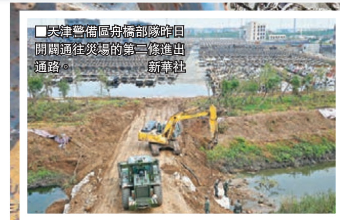
■天津警備區消防隊昨日開闢通往災場的第三條進出通路。