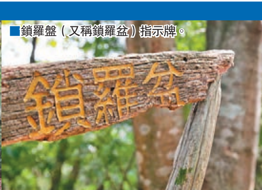
■鎖羅盤（又稱鎖羅盆）指示牌。