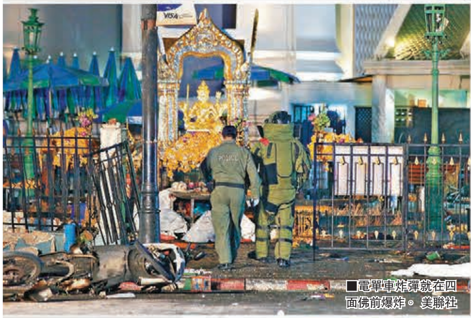
■電單車炸彈就在四面佛前爆炸。