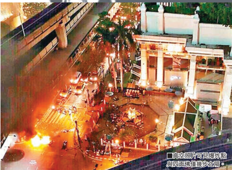
■高空照片可見爆炸點與四面佛僅幾步之隔。

2007年4月9日 曼谷市郊一個商場外發生小型炸彈爆炸，無人受傷，只炸毀3個電話亭。