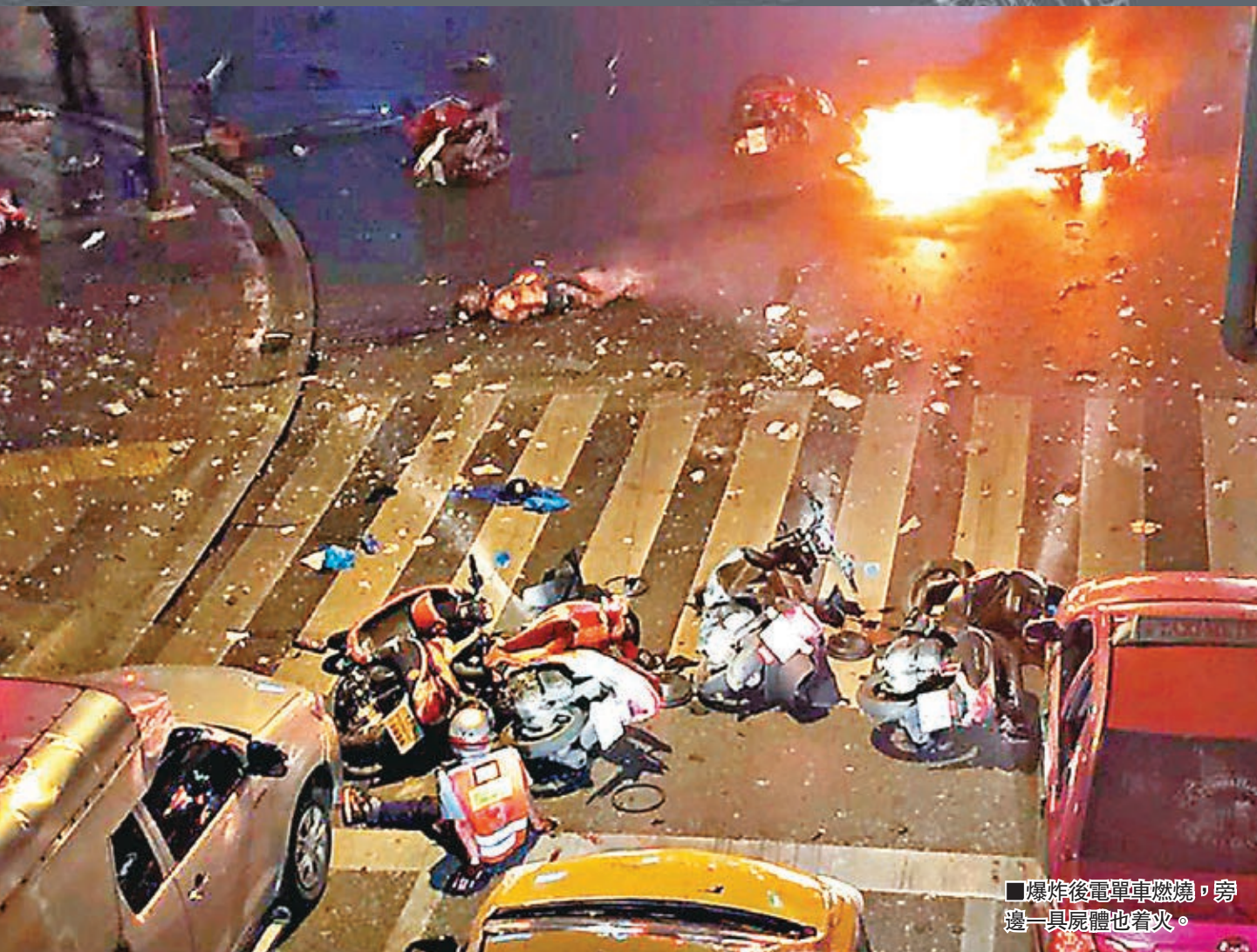
■爆炸後電單車燃燒，旁邊一具屍體也着火。