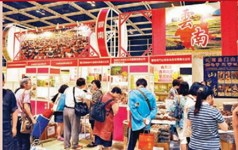
■美食博覽雲南展區遊客絡繹不絕。 本報雲南傳真