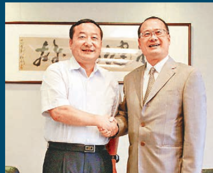
■雲南省副省長張祖林(左)與香港新華集團主席蔡冠深。

「雲南農產品天然、綠色、安全，我們致力向港人提供放心的食品貨源。」13日至15日，雲南省副省長張祖林率代表團參加香港美食博覽並舉辦「2015雲南高原特色農產品推介會」，35家雲企參展，100餘招商項目亮相。期間，代表團與大嘉國際、裕華國貨、新華集團、華潤集團等多家企業達成共識，高位推進滇港農業合作，讓世界共享舌尖上的「雲品」。