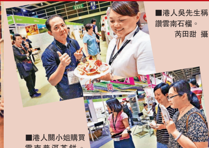
■港人吳先生稱讚雲南石榴。