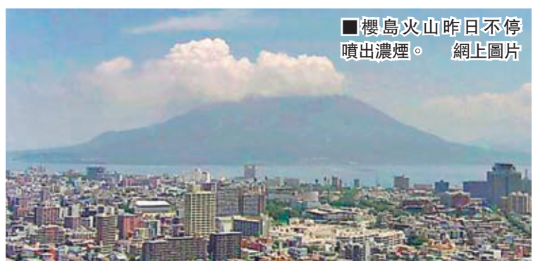
■櫻島火山昨日不停噴出濃煙。 網上圖片

施居民疏散及緊急救災程序。日本政府亦在首相官邸的危機管理中心設立訊息聯絡室，並將召開相關省廳災害警戒會議商討對策。