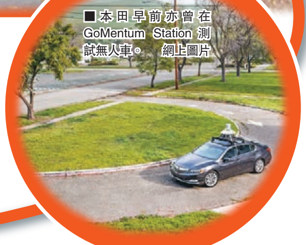
■本田早前亦曾在GoMentum Station測試無人車。