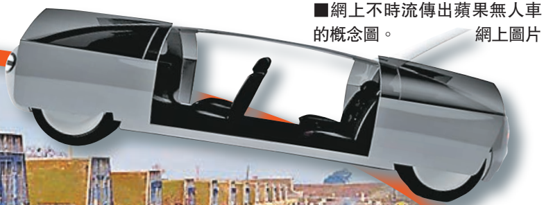
■網上不時傳出蘋果無人車的概念圖。

外界一直盛傳科技巨擘蘋果公司正研發自動駕駛的無人車，英國《衛報》日前根據公共檔案法取得文件，證實蘋果特殊計劃工程師費倫，今年5月曾與加州先進汽車測試場GoMentum Station項目主管霍爾會面，據報平治及本田等汽車公司亦曾在該處測試無人車，反映蘋果研發無人車的進展或較外界預期更快。