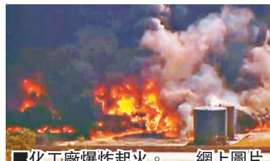
■化工廠爆炸起火。 網上圖片

美國得州一間化工廠前日下午發生連串猛烈爆炸，並引發大火，黑煙直沖半空。兩個儲存化學品的大型倉庫焚毀，當局一度呼籲火場周圍3.2公里範圍的居民留在室內及關閉門窗。消防員花了約兩小時控制火勢，事發時所有職員已下班，因此無人傷亡。有居民擔心空氣質素：「幾名鄰