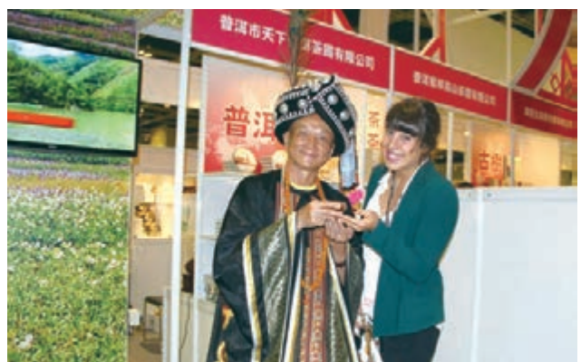
■天下普洱茶國有限公司的普洱曬紅及形象大使大祭師成為展會上的一大亮點。