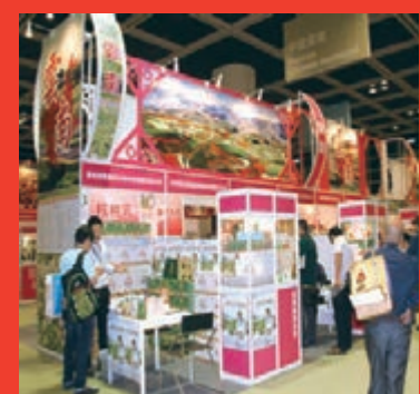
■匯集近100種高原特色農產品的雲南展區。

顧問：趙金 主編：李青 副主編：吳靜波 田虎青 法律顧問：周文輝 發印及承印：香港文匯報有限公司 地址：香港仔田灣海旁道7號奧偉中心2-4樓 主編：雲南省人民政府新聞辦公室 香港文匯報 (香港)特刊部 電話：(0852) 28730888 傳真：(0852) 28733656 (昆明)編輯部 地址：雲南省昆明市青年路118號櫻花麗景4樓 郵政編碼：650021 電子信箱：wwwymfs@163.com 電話：(0871)65115531 傳真：(0871)65110073