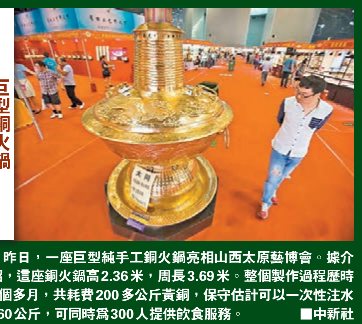
昨日，一座巨型純手工銅火鍋亮相山西太原原藝博會。據介紹，這座銅火鍋高2.36米，周長3.69米。整個製作過程歷時8個多月，共耗費200多公斤黃銅，保守估計可以一次性注水260公斤，可同時為300人提供飲食服務。中新社