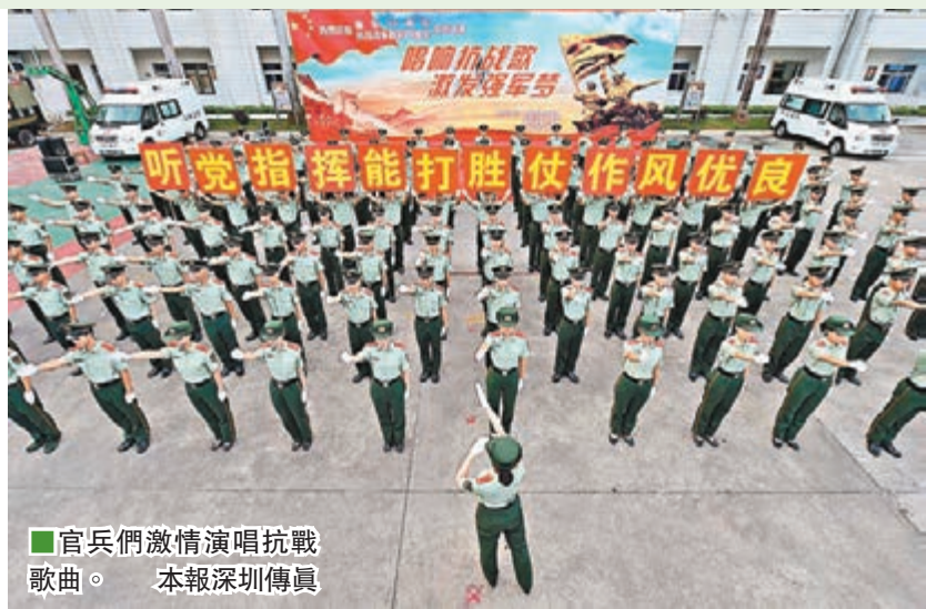
官兵們激情演唱抗戰歌曲。本報深圳傳真

據悉，近年來，武警邊防部隊總醫院（即「深圳武警醫院」）非常注重政治建營、文化強營，全力組建榮譽室、文體活動室、電腦學習室、圖書閱覽室和特色腰鼓隊，把警營文化建設貫穿於為兵服務和醫療保障工作中，有力地推動了警營文化建設，活躍了官兵文化生活。記者 郭若溪，通訊員 黃琦、周少鈞 深圳報道