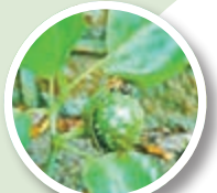
曼陀羅的綠色果實。

曼陀羅是一種白色的花，伴有綠色小球(果實)。掰開看，裡面是一顆顆籽，芝麻般大小，聞着沒什麼味道。曼陀羅花屬劇毒，一般在口服後半小時到2小時即被口腔和胃黏膜吸收而出現中毒症狀。資料來源：大河網