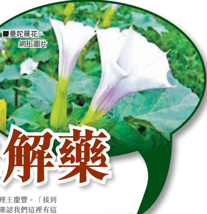
曼陀羅花。網上圖片

陝西西安一名男童近日誤食曼陀羅中毒，急需治療藥物「毛果芸香鹼」，但西安各大醫院都沒有。一位熱心女士看到當地媒體刊發的消息後輾轉聯繫廠家並得知河南鄭州有這種藥物。隨後，鄭州、西安兩地的熱心人和商家開始接力送「解藥」，最終讓男童轉危為安。