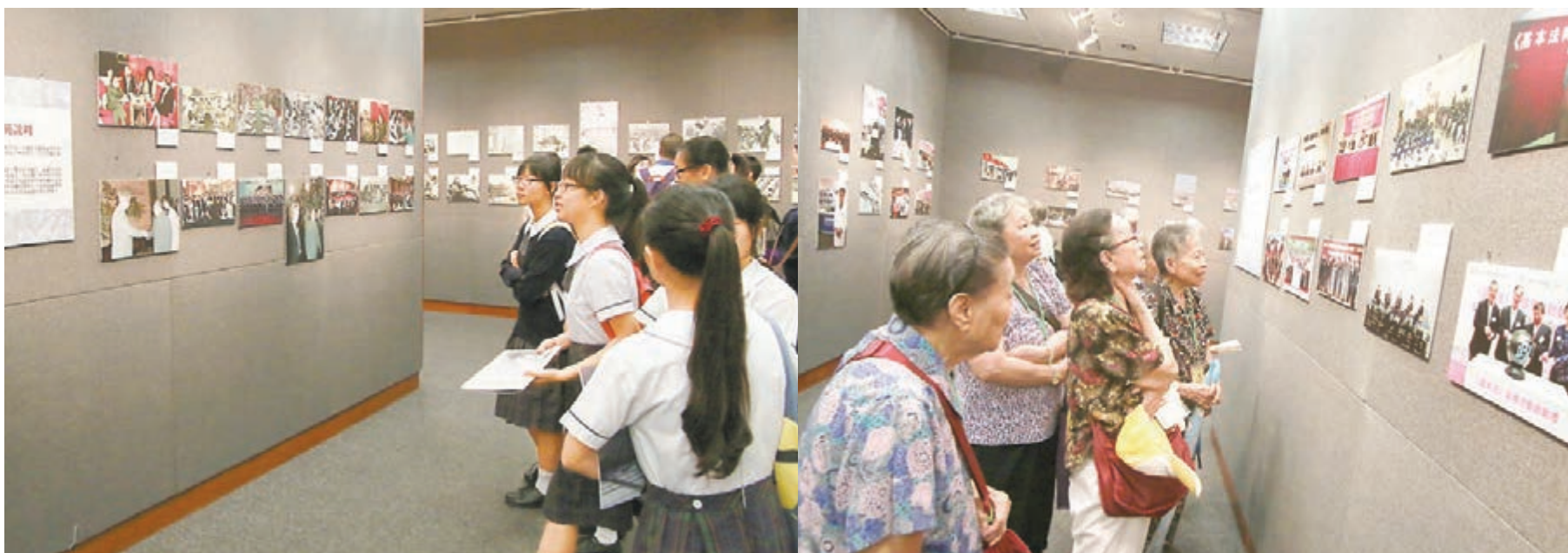
■本報由昨日開始舉行為期3天的基本法頒佈25周年大型圖片展,讓市民可認識香港基本法的歷史、本質和內涵。昨日,不少市民與學生均特意前往觀看,他們均讚揚展覽的資料非常豐富,可了解到國家與香港的密切關係及香港基本法的起草過程,並同樣期盼香港市民均能共同遵守及捍衛得來不易的香港基本法。

應女士則讚揚,今次展覽的主題非常好,可了解到過去不少社會賢能都為香港基本法出一分力,讓香港過去的自由、法治等核心價值得以保存。她希望現今年輕人能多認識過去歷史,不要只懂批評、搞事,破壞香港社會安寧。