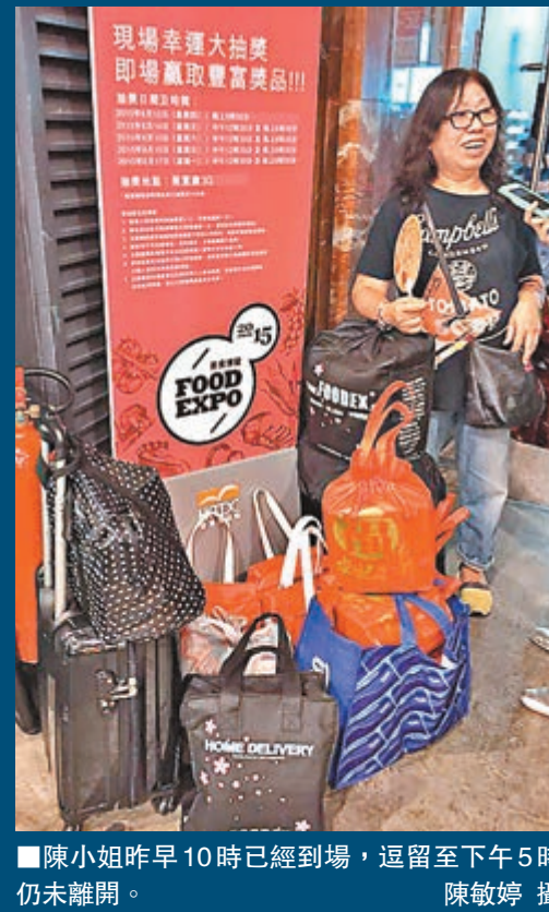
陳小姐昨早10時已經到場，逗留至下午5時仍未離開。