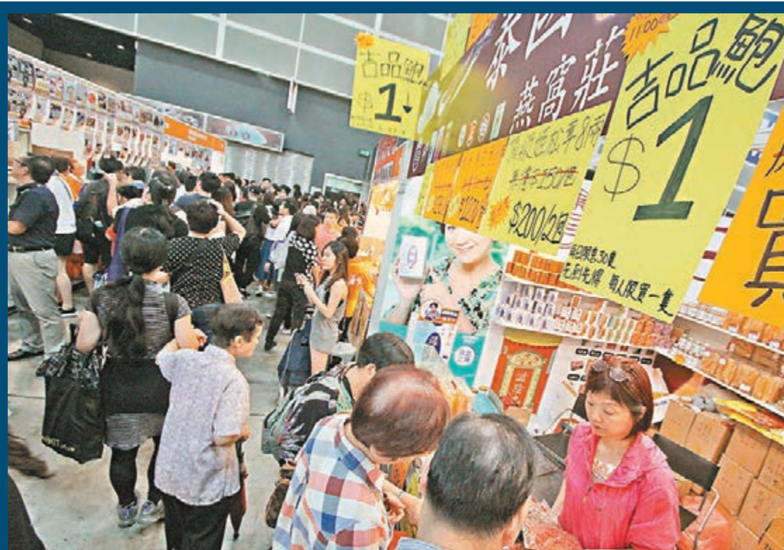
吉品鮑低至1元有售，頂級姬蟲草8兩200元兩包。

來自澳門的陳小姐昨日與數名香港親友到場，她表示，昨早10時已經到場，逗留至下午5時仍未離開，「好累，但值得的，因為平好多。」她表示，花費約兩三千元購買海味，認為比外面平三四成，但未有光顧場內熟食檔。另一名來自澳門的黃小姐表示，合共花費1.8萬元購買月餅、日本水果與急凍食品，已帶備兩個分別28吋及23吋的行李箱，「裝滿先走。」