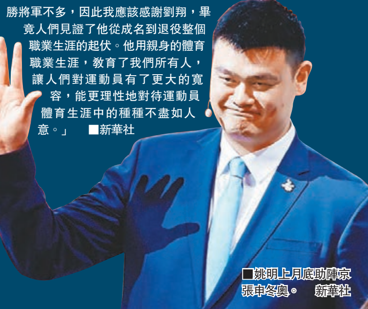
姚明上月月底助陣京張申奧。新華社