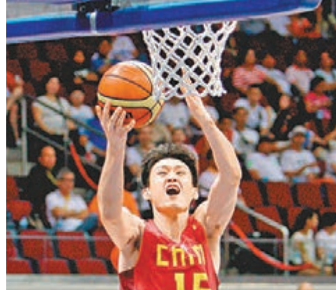
中國男籃在上屆亞錦賽不敵中華台北無緣四強。