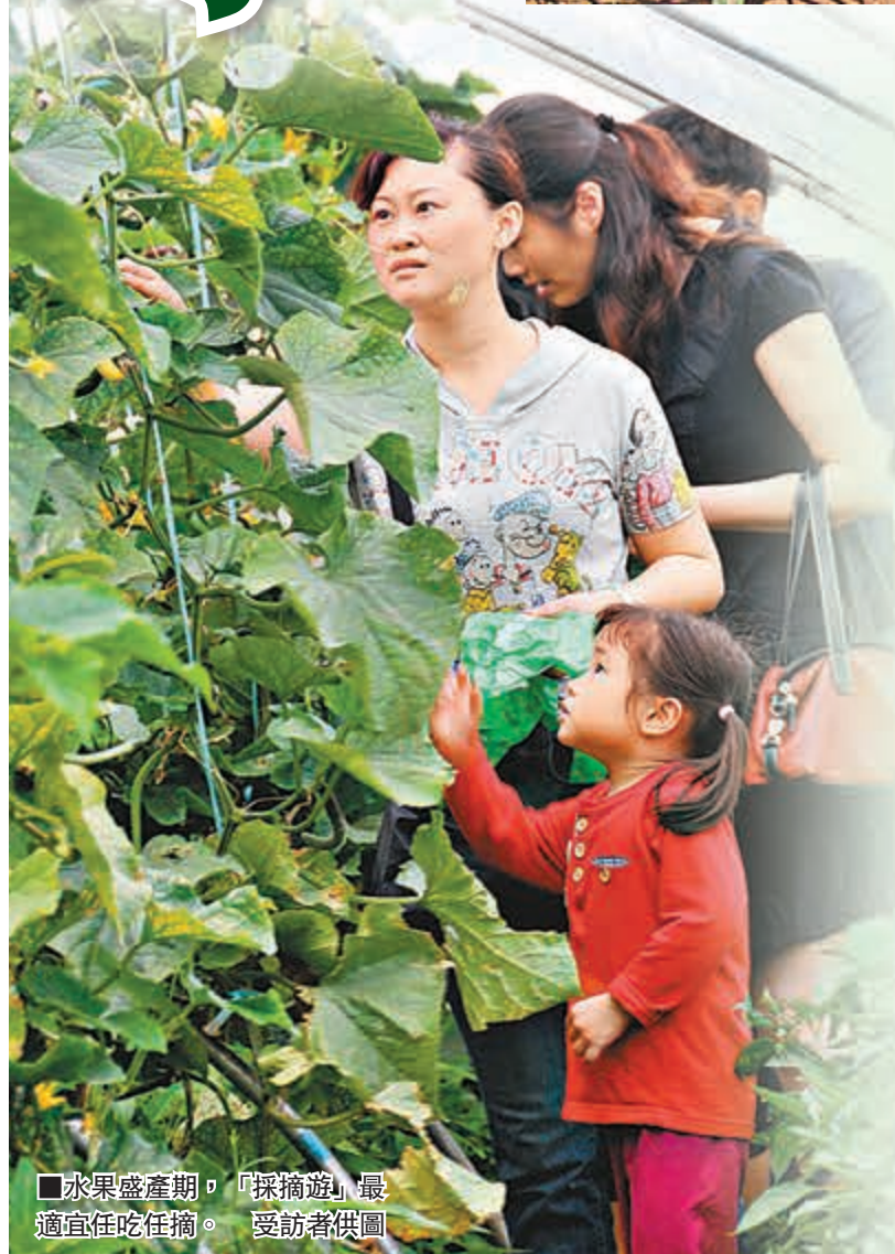
水果盛產期，「採摘遊」最適宜任吃任摘。