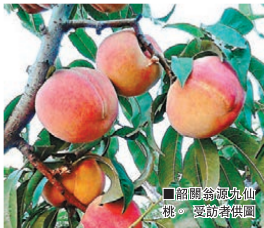
韶關翁源九仙桃。

★推薦地：韶關翁源縣李洞村 ★採摘時間：7月中旬到8月下旬 韶關翁源縣有「中國九仙桃之鄉」之稱。九仙桃聞之清雅芬芳，入口無澀且有蜜味，爽脆清甜滿口香，帶有水果般的那種絲絲的甜味，洗乾淨不剝皮即可吃，口感非常好。 每年七八月，九仙桃陸續上市。在滿滿的兩個月間，韶關翁源縣江尾鎮到處大片桃樹碩果累累，桃子泛着鮮紅的迷人景色。李洞村是翁源縣採摘九仙桃的勝地，每逢周末，到處可見大批廣州、珠海、佛山、東莞牌照的私家車不請自來，擠得小村道水洩不通。 推薦玩法： 遊客一早到達韶關翁源縣，可先遊覽「南方第一大園」之滿堂客家圍屋。圍屋建於清道光十三年，整體上分為中新圍、上新圍和下新圍三部分，全部由水磨青磚、青石拱門構建，裡外三層的結構。午飯過後等太陽稍退後，可再進入桃園開始採摘和採購，這段時間馬路兩邊的果農會把早上新鮮採摘的桃子包裝準備好，供遊客購買。