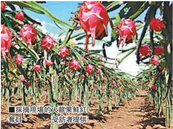
採摘現場的火龍果鮮紅奪目。

★推薦地：從化市大丘園農莊、從化仙居農莊 ★採摘時間：6月到12月 盛夏正是火龍果成熟的黃金季節。炎炎夏日，吃上一口火龍果，既補充水分，又能解饑。火龍果又稱「仙蜜果」，營養豐富，常吃有保健功效。 從化有「廣州後花園」的美稱，各式農莊果園、溫泉、漂流，遠離繁華都市，空氣清新宜人。從化火龍果園裡，掛滿紅色火龍果，紅綠相互輝映，鮮艷奪目。 推薦玩法： 從化有很多火龍果採摘農莊，較受歡迎有大丘園和仙居農莊。這裡不僅有常見的紅皮紅肉、紅皮白肉火龍果，還有自主研發的白肉火龍果。 大丘園內山清水秀，記者親手摘了一個紅肉火龍果，刀鋒既下，碩大的火龍果一分为二，鮮艷奪目的紫紅色果汁霎時濺出。紫紅色的果肉，看上去已教人大飽眼福了，嘗之只覺清香撲鼻，滑嫩味甜，確比一般市場上賣的火龍果味美得多。 餘興未盡，港人可到仙居農莊的農家餐廳品嚐一頓「火龍果」宴。據廚師大哥介紹，火龍果全身是寶，從果皮到果肉都能食用。一道鮮炸火龍果，外脆內軟，口感極佳；火龍果皮炒肉絲，香甜可口，非常值得品嚐。