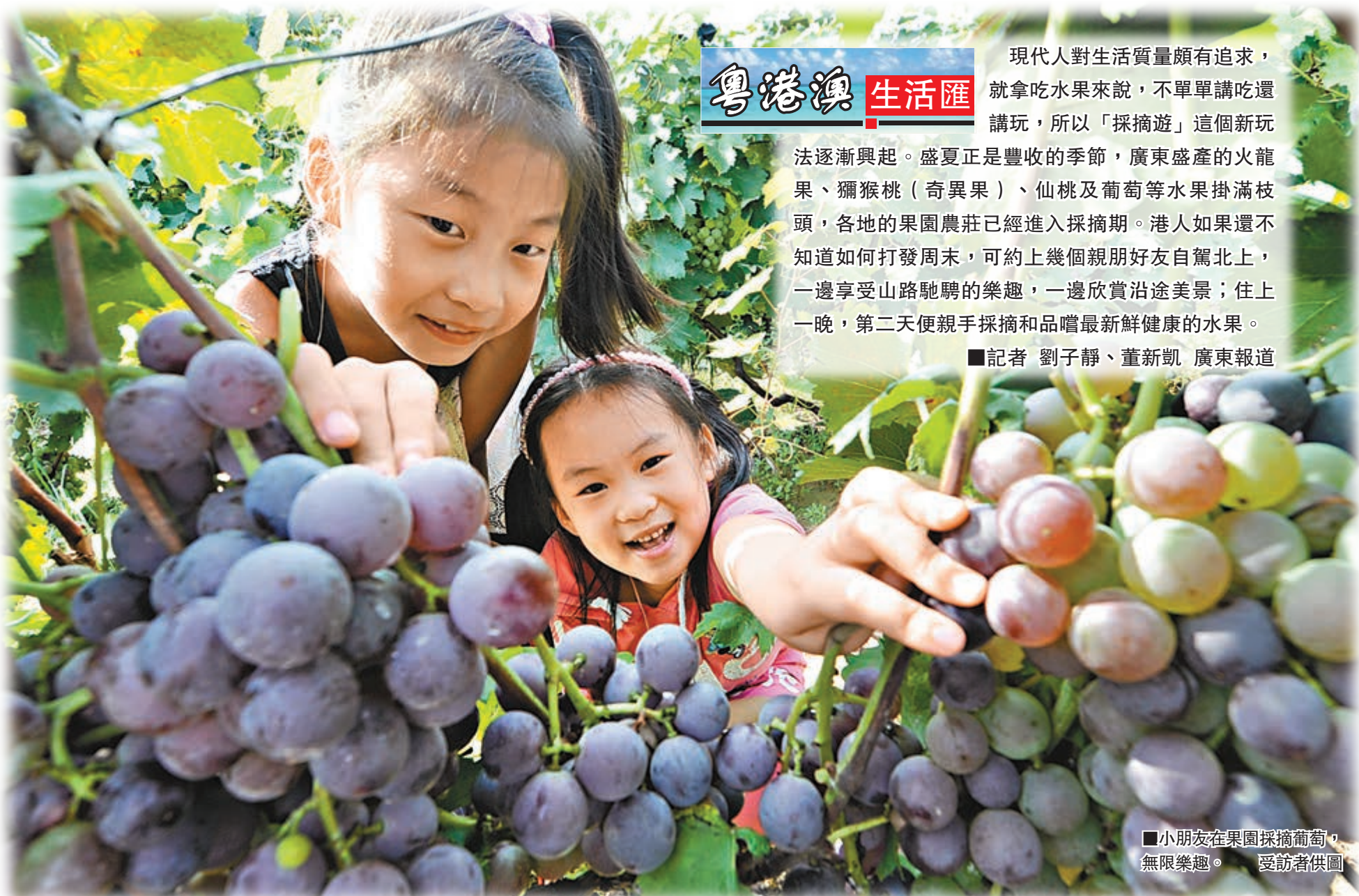
小朋友在果園採摘葡萄，無限樂趣。