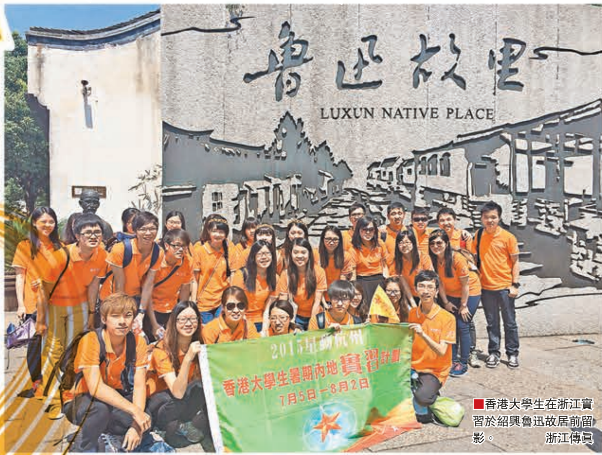
香港大學生在浙江實習於紹興魯迅故居前留影。

香港文匯報訊（記者 俞畫、高施倩 浙江報道）由香港文匯報、未來之星同學會、浙江省青年聯合會等聯合主辦的「未來之星 星動杭州」2015香港大學生暑期內地實習計劃，於7月5日至8月2日在杭州順利舉行。來自香港大學、中文大學、城市大學、科技大學等10所香港高校的36名大學生獲安排在中國移動、綠城物業服務集團、浙江省人民醫院、中國人壽財險等13家在浙企業實習一個月。