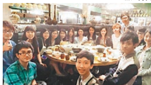
空餘時間不少學生在杭州嚐當地美食。