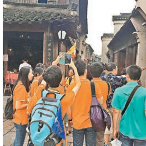
學生參觀古鎮拍照留念。