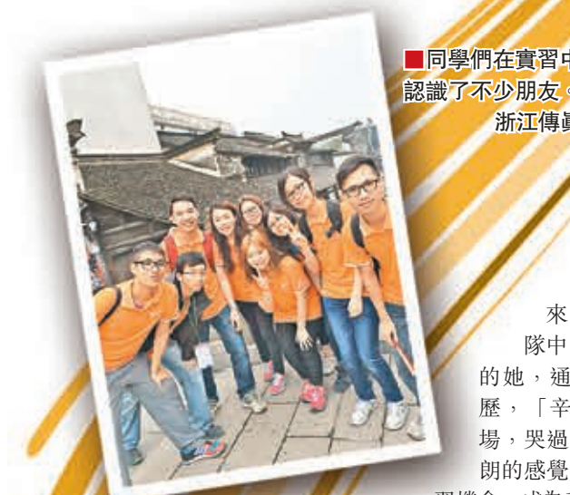
同學們在實習中認識了不少朋友。