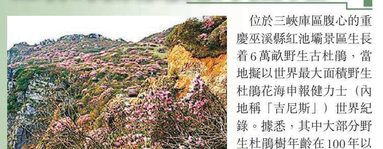
位於三峽庫區腹心的重慶巫溪縣紅池壩景區生長着6萬畝野生杜鵑，當地擬以世界最大面積野生杜鵑花海申報健力士（內地稱「吉尼斯」）世界紀錄。據悉，其中大部分野生杜鵑樹年齡在100年以上，已發現的最大杜鵑樹胸徑超過30厘米。

重慶巫溪縣紅池壩景區工作人員介紹，當地高山杜鵑分佈在海拔1000米至3000米之間，每年4至5月杜鵑花開得最盛時，漫山花海極其壯觀。目前，景區還將規劃建設4萬平方米露營地，打造西部最大的露營基地，讓遊客可以在花海中露營，享受自然。 ■記者 袁巧 重慶報道