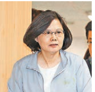
蔡英文宣佈，由高雄市長陳菊擔任其「競選總部主委」。中央社

香港文匯報訊 民進黨「2016大選」參選人蔡英文昨日宣佈，高雄市長陳菊任「競選總部主任委員」，希望發揮戰力；媒體追問，這代表陳菊不可能是副手？蔡英文說：「這個問題不好，沒有必然的連結性。」