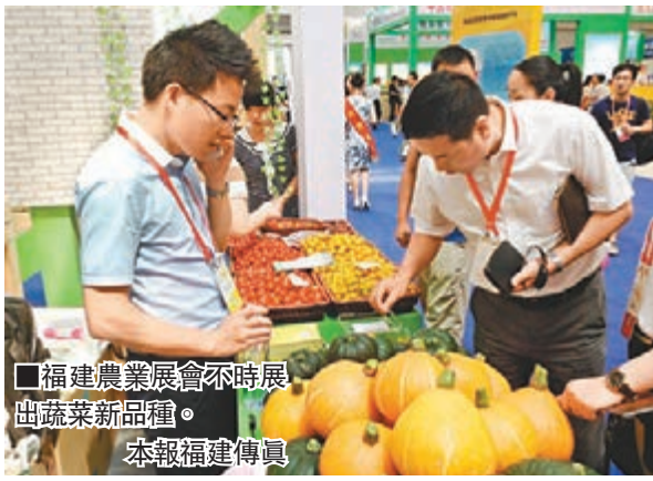
■福建農業展會不時展出蔬菜新品種。

近年,福建農產品進出口呈增勢,並帶動地方產業集羣的壯大。據海關數據統計,2014年福建實現農產品進出口152.5億美元,同比增長8.6%,安溪茶葉、福州水產、三明林產加工、莆田果蔬等特色鮮明的農業產業集