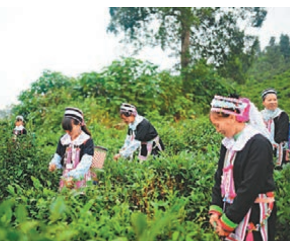
■雲南農業發展具有得天獨厚的地理、氣候、生態資源等優勢。圖為雲南茶園基地。

香港文匯報訊(記者譚旻煦報導)一年一度的香港美食博覽明天開幕,以「綠色生態」為招牌的雲南高原特色農產品將集中亮相。雲南省副省長張祖林率團將於同期在港舉行「2015雲南高原特色農產品香港推介會」,推介雲南美食,力邀港各界共建共享「一帶一路」,在雲南打造全球重要、穩定、可靠的農產品供應基地中共享商機。滇港合作的歷史源遠流長,去年雲南對香港地區出口農產品金額已超過6億美元;今年上半年,雲南對香港農產品出口金額就達到了3.13億美元。