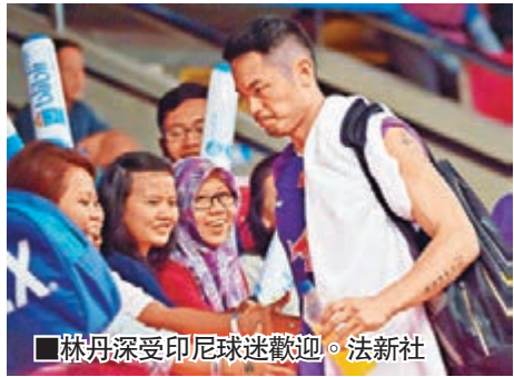
■林丹深受印尼球迷歡迎。