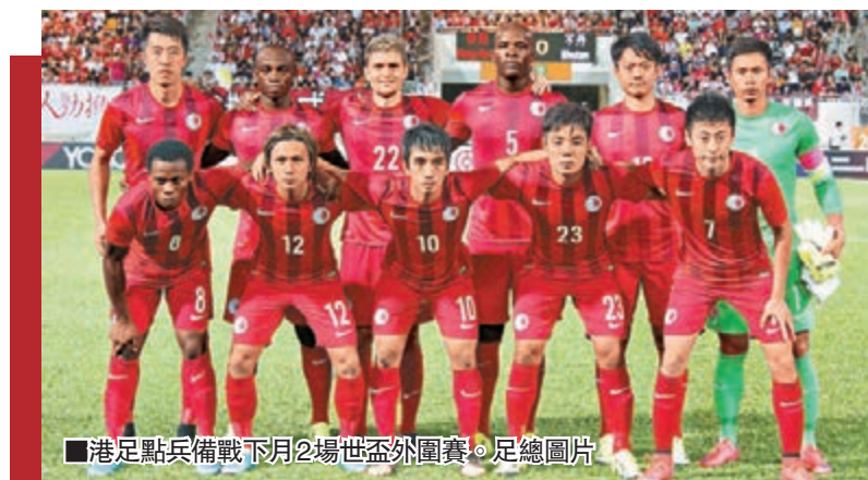
■港足點兵備戰下月2場世盃外圍賽。

廉絲則出師不利，遭德國代表莉絲姬以6:0、6:3擊倒，慘嘗「一輪遊」。 ■記者 鄭御龍