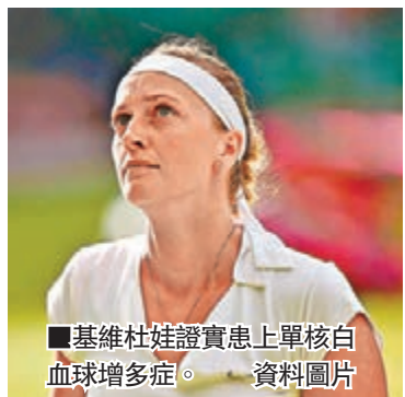
■基維杜娃證實患上單核白血球增多症。資料圖片

羅傑斯盃其他女單比賽方面，意大利的彭妮達在首圈以總數2:0擊敗「本地薑」達寶絲姬，下場要跟美國好手莎蓮娜威廉絲(細威)爭入第3輪，但細威胞姊維納絲威