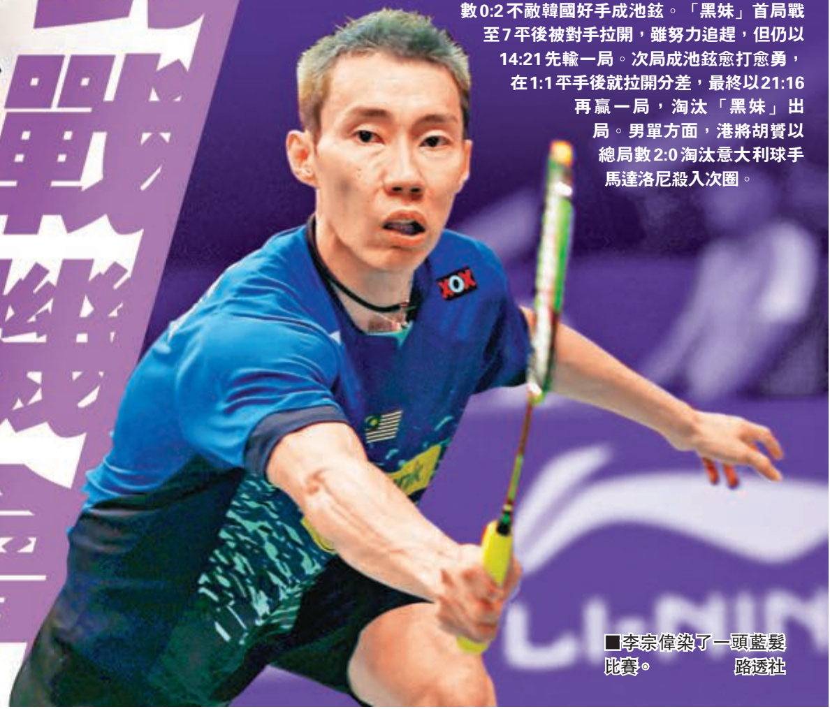
■李宗偉染了一頭藍髮比賽。

至於港隊女單好手「黑妹」葉楓延在次圈以總局數0:2不敵韓國好手成池鉉。「黑妹」首局戰至7平後被對手拉開，雖努力追趕，但仍以14:21先輸一局。次局成池鉉愈打愈勇，在1:1平手後就拉開分差，最終以21:16再贏一局，淘汰「黑妹」出局。男單方面，港將胡贊以總局數2:0淘汰意大利球手馬達洛尼殺入次圈。