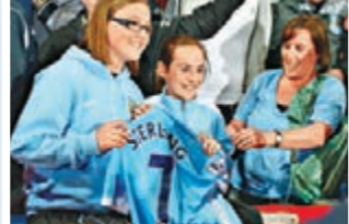
曼城女粉絲獲史達寧親手送上7號波衫。