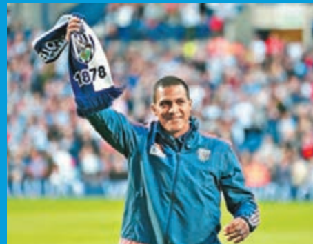
朗頓與西布朗球迷打招呼。