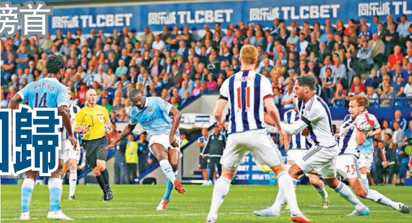
耶耶托尼(左三)射入第2球。