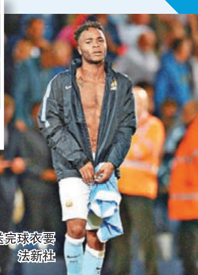
史達寧送完球衣要穿上外套。