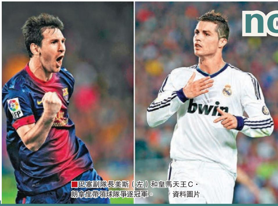
巴塞副隊長美斯(左)和皇馬天王C·朗拿度帶領球隊爭逐冠軍。資料圖片