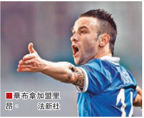
華布拿加盟里昂。