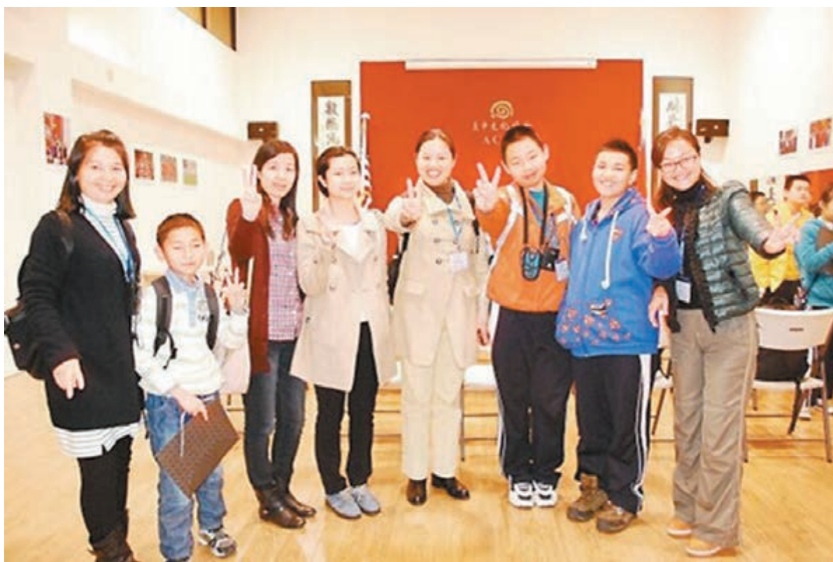
中國赴美留學生日益低齡化。