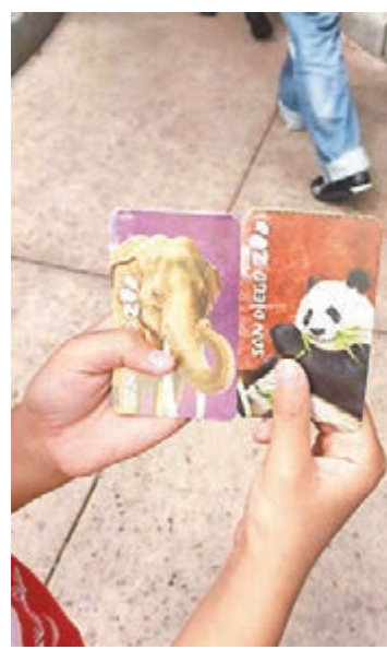
郭女士帶着小學生女兒赴美考察探路。

蔓延到美國,她在洛杉磯看房,當地中介告訴她加利福尼亞州學區按照轄區內的學校綜合評分排名,10分是滿分,8分以上則是高分。