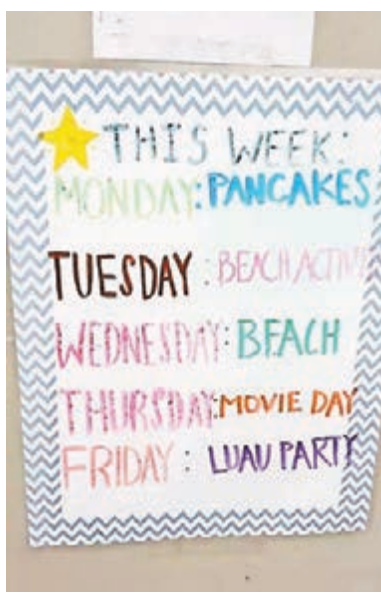
美國夏令營每日活動表。