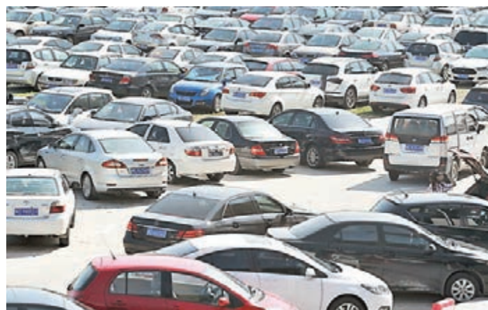
七部門聯合發文明社會資本投資停車場建設。圖為福建泉州一停車場。

在停車收費政策方面,《意見》指出,逐步縮小政府定價範圍,全面放開社會資本全額投資新建停車設施收費。對於路內停車等納入政府定價範圍的停車設施,健全政府定價規則,根據區位、設施條件等推行差別化停車收費。在停車智能化方面,《意見》明確,支持移動終端互聯網停車應用的開發與推廣,鼓勵出行前進行停車查詢、預訂車位,實現自動計費支付等功能,提高停車資源利用效率。