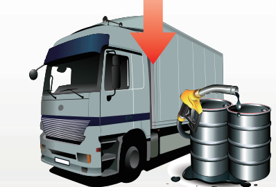
深圳黑油窩點以每升3.5元人民幣收購走私油後，再以每升5元人民幣出售，黑油窩點每1,000升可獲非法利潤高達1,500元人民幣。整個走私柴油鏈條的非法利潤超過70%。