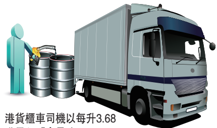
港貨櫃車司機以每升3.68港元入「會員油」。