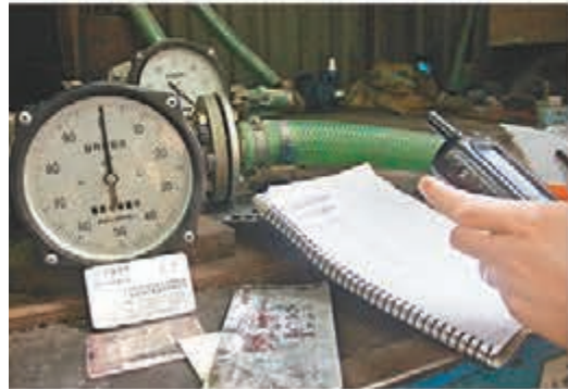
走私柴油交易賬簿。

但王志表示，未來深圳海關緝私局會更精準監測兩地牌貨櫃車的行駛公里數、油箱尺寸等以提高打擊力度。