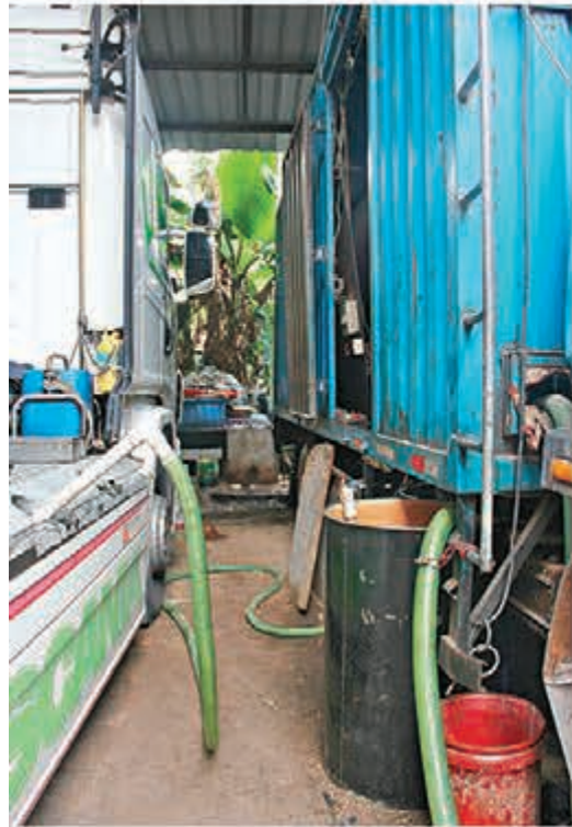
走私柴油裝卸現場。