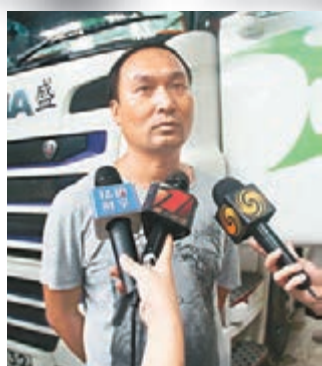
余姓司機表示因一時貪念犯法。