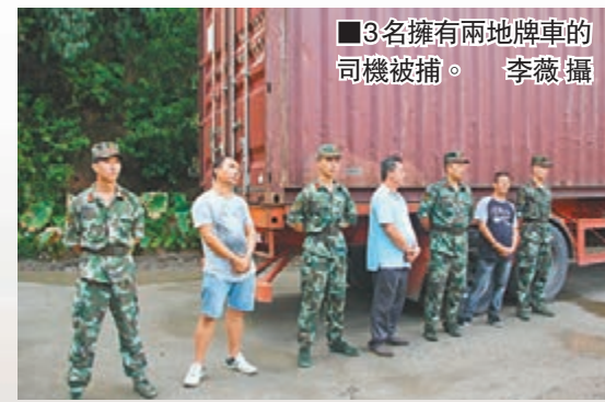
3名擁有兩地牌車的司機被捕。

此外，記者了解到，目前在緝私辦案中，對利用兩地牌車牌走私柴油的嫌疑人懲罰力度較小。深圳海關緝私局相關負責人表示，未來該局將充分利用現有的法律規定，在發生此類案件後會及時對比緝私辦案系統數據，如果涉案司機有多次走私行為，可按刑法對一年內因走私被給予二次行政處罰後又走私的予以定罪處罰，並追究刑事責任。