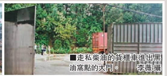
走私柴油的貨櫃車進出黑油窩點的大門。