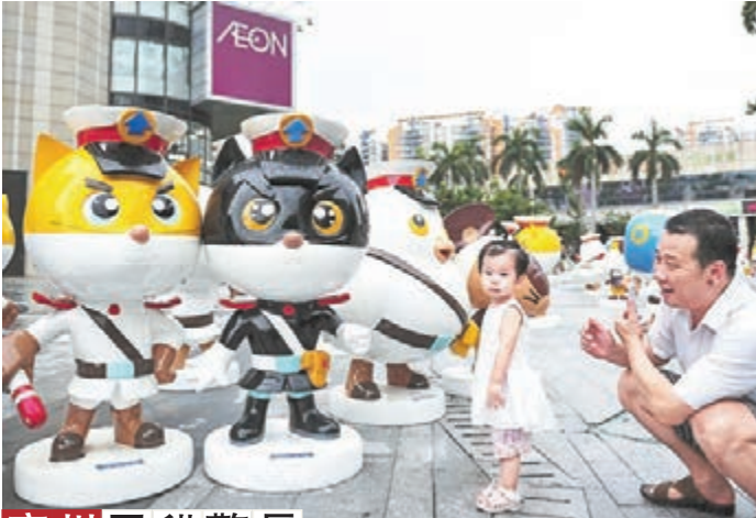
廣州黑貓警長 廣州首個「黑貓警長展覽」亮相廣州一商城,過百個「黑貓警長」卡通角色造型吸引市民眼球。

香港文匯報訊(記者 徐悅 貴陽報導)貴州省政府辦公廳近日出臺《關於加快發展體育產業促進體育消費的實施意見》(下稱《意見》),明確要推動公共體育場館設施開放利用,推動全省各級各類公共體育設施免費或低收費開放。《意見》提出,學校體育場館課餘時間向學生免費開放,並加強安全保障;在確保校園教學和安全的基礎上,積極推動有條件的學校體育設施向社會開放。同時,凡是由各級財政或體育彩票公益基金投入建設的鄉鎮及社區體育惠民工程、室外健身場地和健身路徑,一律免費使用。