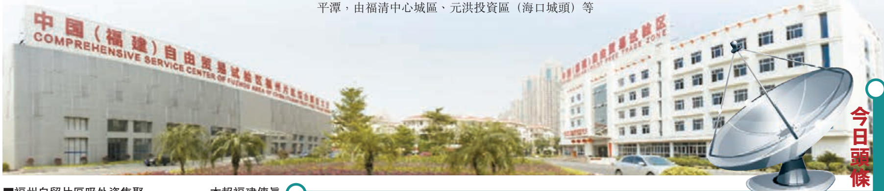
福州自貿片區吸外資集聚。

福州市規劃局人士介紹,《總體規劃》增加了城鄉統籌發展和鄉村發展規劃內容,是最大亮點。「推進各類工業園區的空間整合、劃出永久性的生態保護地區、以發展城鄉公路客運為主體,推進城鄉交通一體化建設等,都是此次新版總規增加的內容。」