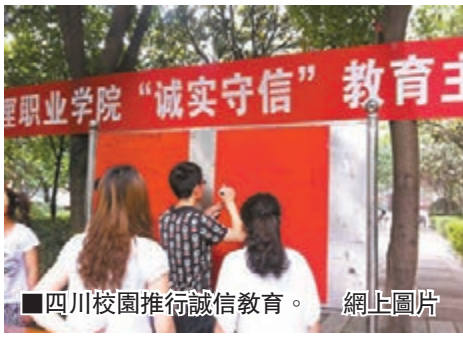
四川校園推行誠信教育。

香港文匯報訊(記者 劉銳、實習記者 宗露寧 成都報導)從四川成都市人民政府新聞辦公室日前獲悉,成都獲批成為內地11個創社會信用體系建設示範城市之一,是西部地區唯一獲批城市。