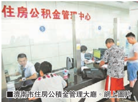
濟南市住房公積金管理大廳。

香港文匯報訊(記者 楊奕震、實習記者 杜學皎 山東報導)山東省出臺《關於完善公積金管理體制擴大住房消費的指導意見》。今後,山東省內市民購買首套房、二套房最低首付款比例分別由30%、50%降到20%、30%。此外,取消了貸款額與職工賬戶繳存餘額掛鉤的限制,並推進異地貸款,取消山東省內異地貸款戶籍地的限制,望借此進一步釋放結餘資金、提高資金使用效率。此次住房公積金貸款政策的調整主要集中在兩方面:一是首套房最低首付款比例調整。繳存職工家庭使用住房公積金委託貸款購買首套普通自住住房,最低首付款比例統一調整為20%,對建築面積90平方米以上的住房貸款不再執行30%的最低首付款比例要求。二是改善性住房最低首付款比例調整。擁有1套房並已結清相應購房貸款的繳存職工家庭,為改善居住條件再次申請住房公積金委託貸款購買普通自住住房,最低首付款比例由50%調整為30%。